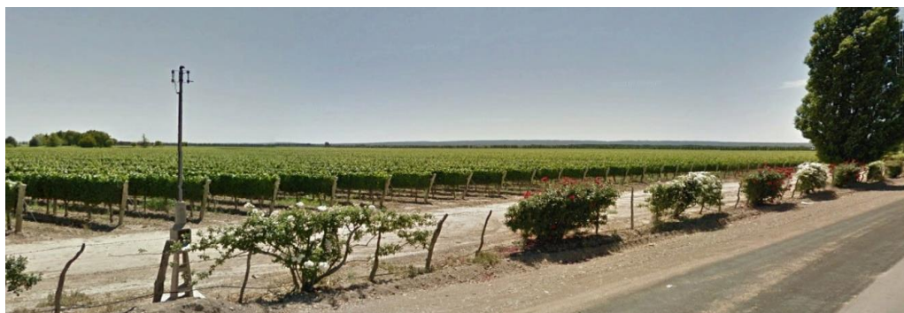
Figura 4. Vista del punto de observación PO - 81 Ruta 86 y Cobos Distrito de Ugarteche Departamento Luján de Cuyo. En el mismo se observa un ALTO valor de Homogeneidad del uso del