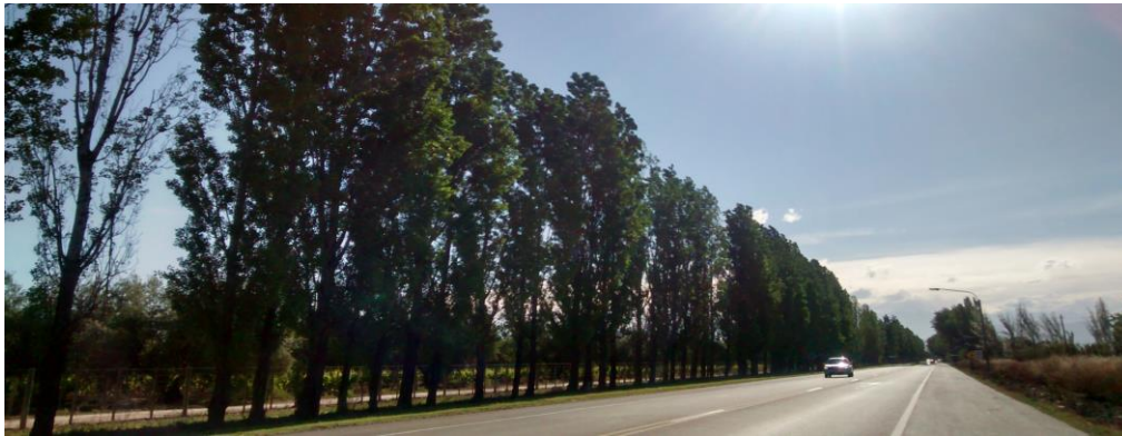
Figura 5. Vista del punto de observación PO 40 Ruta 60 Y Nazar Departamento de Maipú. En el mismo se observa una visibilidad estructural focalizada.