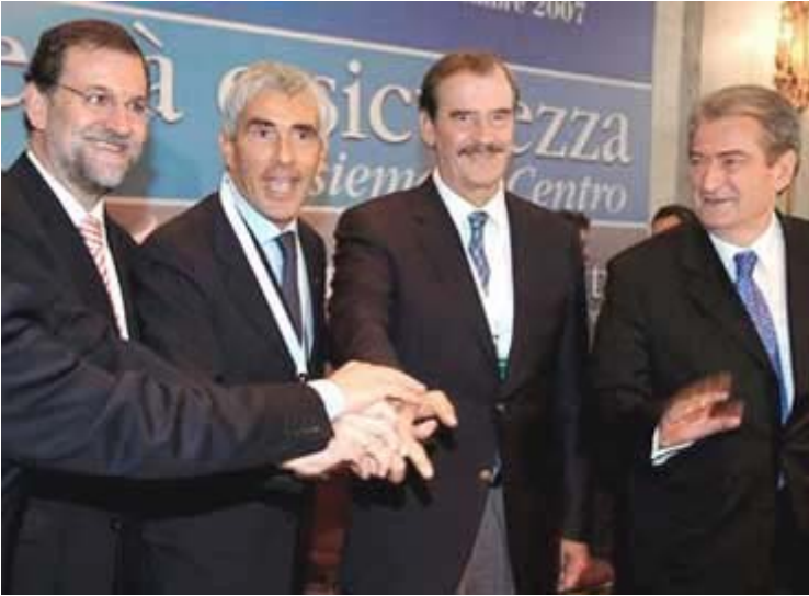
Octubre del 2007. Vicente Fox, primer presidente panista, ungido como co-presidente de la Internacional Demócrata Cristiana.