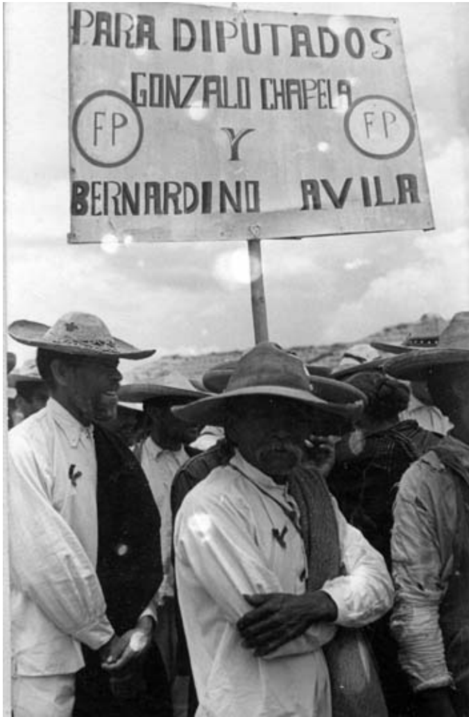
Contingentes del Partido Fuerza Popular de la Unión Nacional Sinarquista apoyando a diputados de unidad durante la campaña presidencial de Don Efraín González Luna. Mayo de 1952.