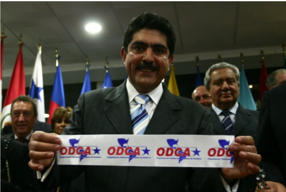
En el 2006 Manuel Espino, entonces Presidente Nacional del PAN, ganó la presidencia de la Organización Demócrata Cristiana de América (ODCA).