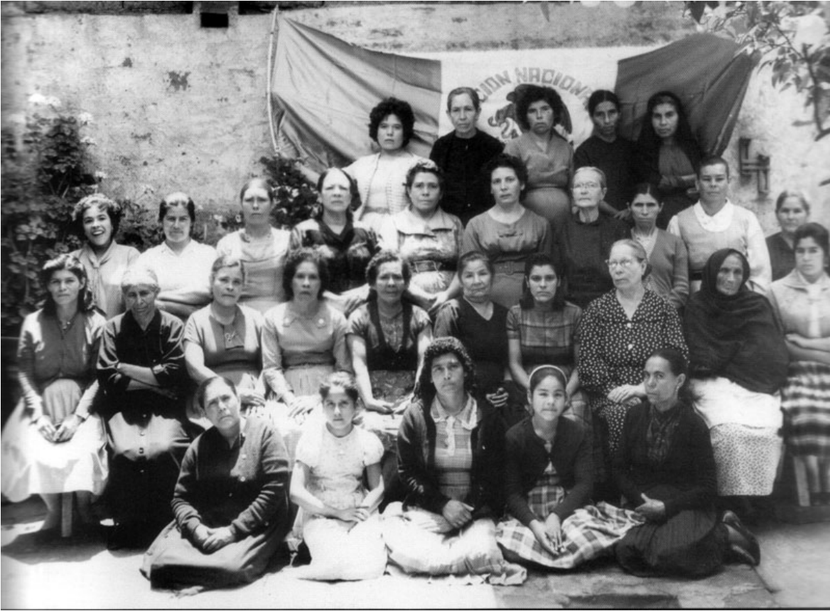
Presencia femenina en el partido.