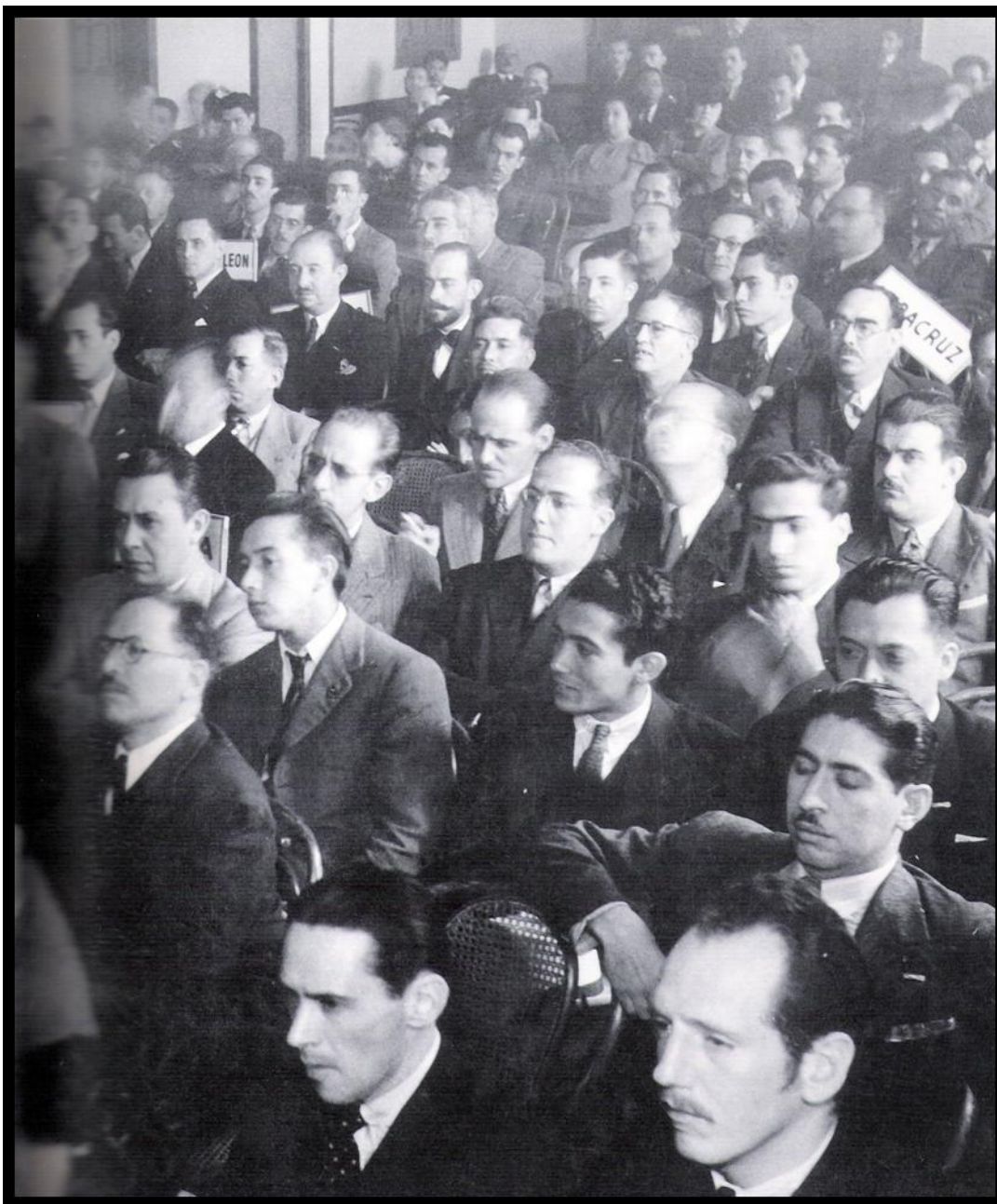
Asamblea de fundación del Partido Acción Nacional el 16 de septiembre de 1939 en el Distrito Federal.