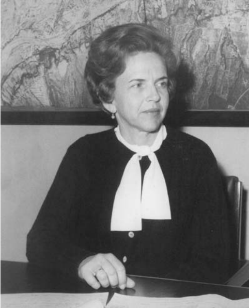
Norma Villarreal de Zambrano. Primera alcaldesa de oposición. San Pedro Garza García en 1967.