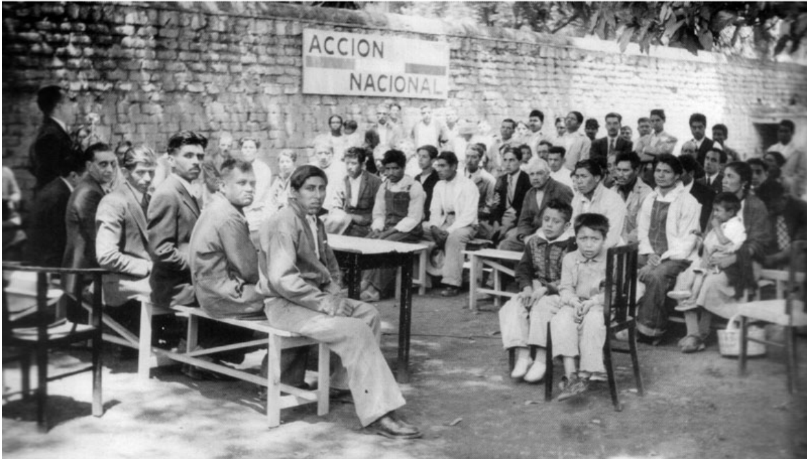
Primera asamblea panista en Tlalpan, DF. Enero de 1940.