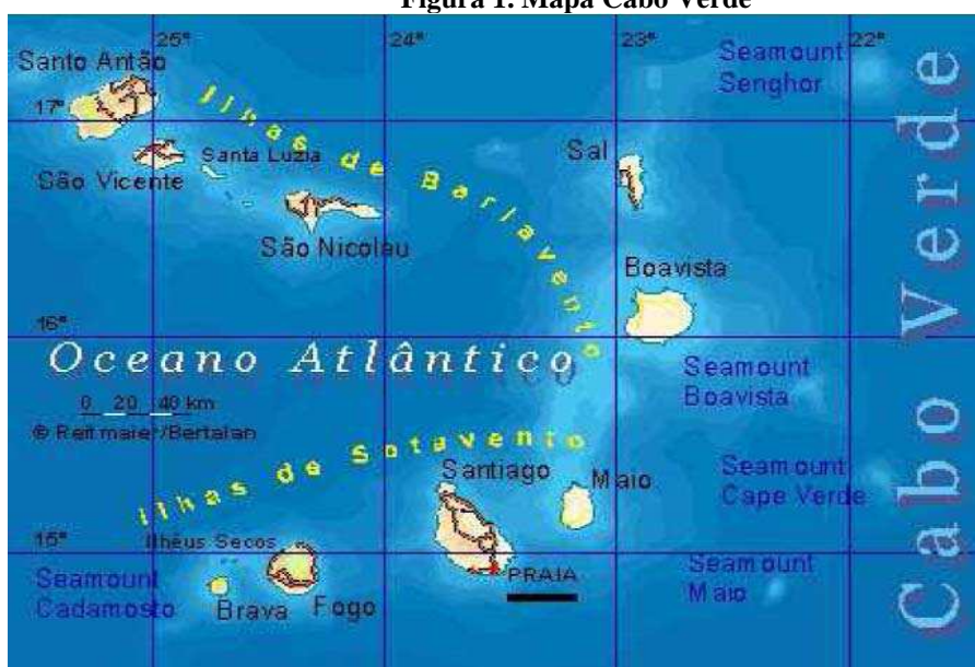
Figura 1. Mapa Cabo Verde