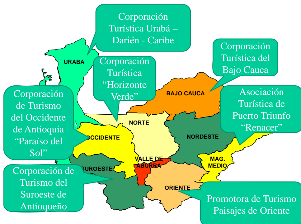
Figura 1. Mapa regional – Corporaciones