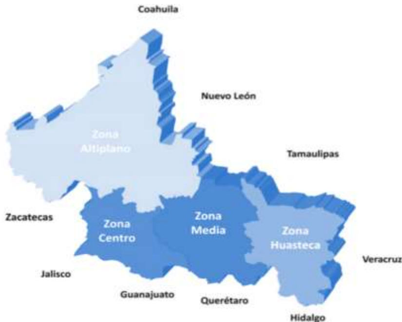
Figura 1. Regionalización del estado de San Luis Potosí