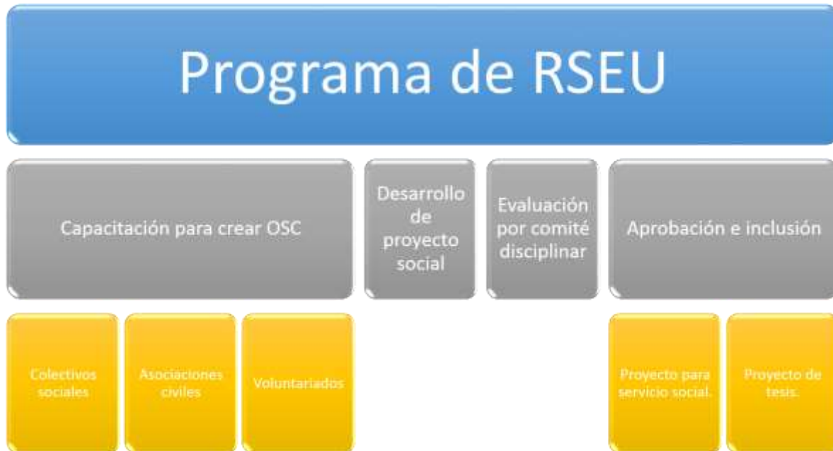
Figura 5. Componentes de trabajo para la formación de la Responsabilidad Social en el Estudiante Universitario.

De esta forma se cumplen varias expectativas de innovación, inclusión, pertinencia, fortalecimiento de competencias, formación de ciudadanos responsables, que se requieren en nuestra sociedad, pero aún más al tener de cerca contextos desfavorecidos tan cercanos como los que se presentan en la Huasteca Potosina Sur.