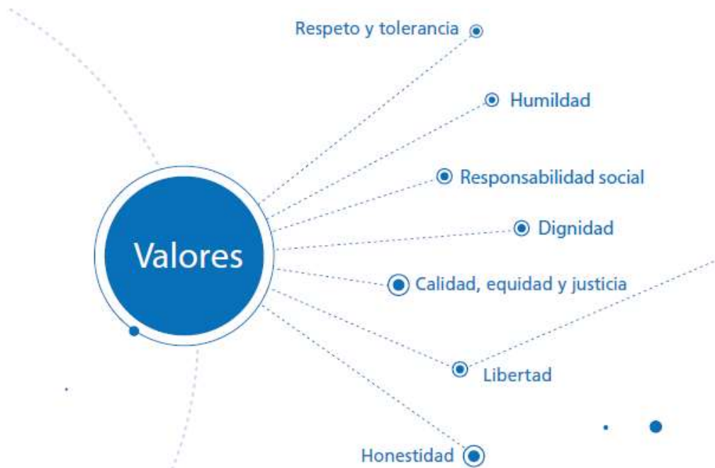
Figura 3. Los valores fundamentales de la UASLP