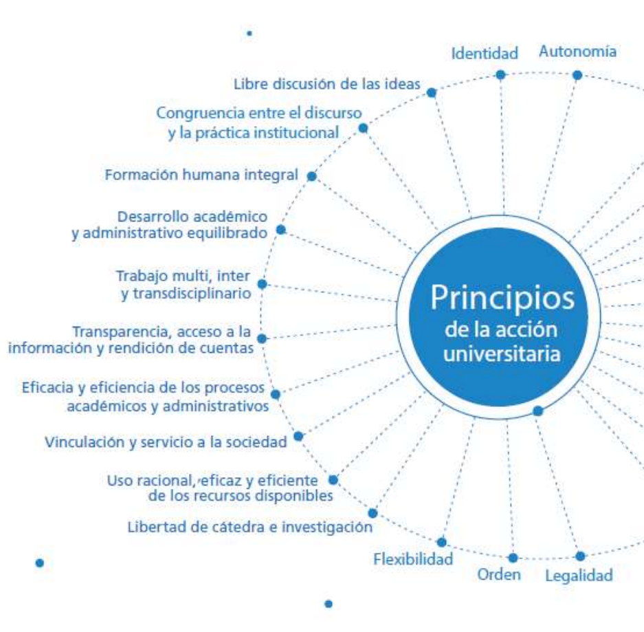
Figura 4. Los Principios Universitarios