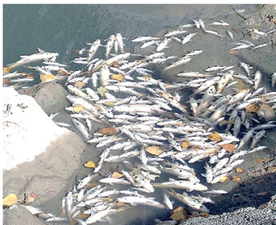
Figura 5 mortandad de peces en el Río Gallinas