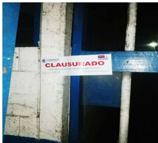
Figura No. 3 instalaciones Clausuradas Ingenio Popular

De acuerdo a datos estadísticos de la Confederación Nacional Campesina (CNC) en el 2019, de cada peso que circula en la localidad 70 centavos provienen de la actividad cañera. El Ingenio Alianza Popular está ubicado en el municipio de Tamasopo, SLP., 4556 productores de caña abastecen a esta unidad industrial, con una capacidad de molienda de 8000 toneladas de caña por día y un promedio de 1 450 000 toneladas anuales. Sin embargo, a pesar de ser una de las empresas más rentables del país, y encontrarse certificada como una industria limpia enfrenta grandes retos ambientales.