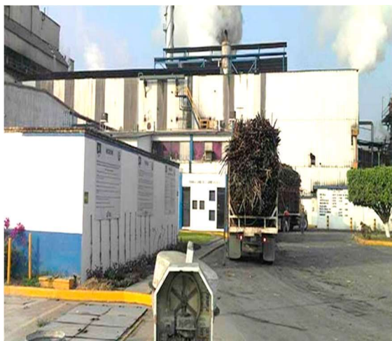
Figura No. 2 instalaciones Ingenio Alianza

CONAGUA constató la responsabilidad del Ingenio Alianza Popular en la contaminación del Río Gallinas y procede a clausurar la factoría en apego a la Ley de Aguas Nacionales. La empresa reconoció su responsabilidad asumiendo que tuvieron un evento que se les salió de control ya que realizaron descargas en un punto fuera de los que tienen autorizados. Las autoridades impusieron una sanción y obligaron al ingenio a presentar acciones para remediar la afectación de la zona.