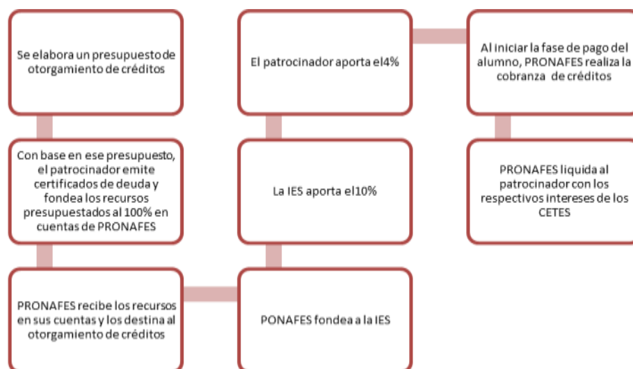
Figura 3. Fondo de recursos

Los fondos ingresan de manera temporal (préstamo) al PRONAFES, por lo que, con cada crédito que se coloca, las universidades aportan el 10% a un capital de consolidación por cada disposición que realicen sus alumnos, más un 4% para gasto operativo que aporta el gobierno federal. Prácticamente con este 14% y con una buena administración, el fondo se capitaliza, se hace autosuficiente y a los 5 años prácticamente ya tiene la capacidad de empezar a pagar los recursos con un interés o rendimiento atractivo. Además con esos fondos que se van capitalizando se crea una provisión de reserva para incobrables, que se estima sería mínimo, debido a las políticas y reglamentos que se establecerían y a los esfuerzos conjuntos de las distintas autoridades y entidades a nivel nacional, como es el caso de Buró Nacional de Crédito, Secretaría de Relaciones Exteriores, Secretaría de Educación Pública y Secretaría de Hacienda y Crédito Público, entre otras (en lo sucesivo se denominarán como organismos relacionados). El programa es de largo plazo, los fondos han de captarse así y han de colocarse con ese horizonte de tiempo. La visión y enfoque son totalmente estratégicos.