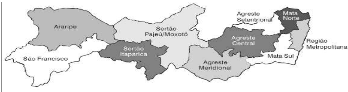
Mapa 01. Regiões de desenvolvimento do estado de Pernambuco