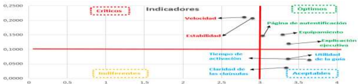
Figura 2. Matriz de atributos