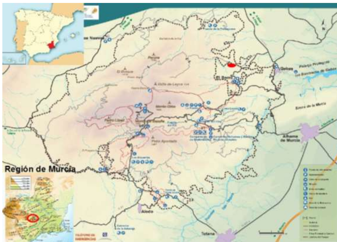
Figura 1. Localización del Parque Regional de Sierra Espuña.

Fuente: elaborado a partir de murcianatural (2018).