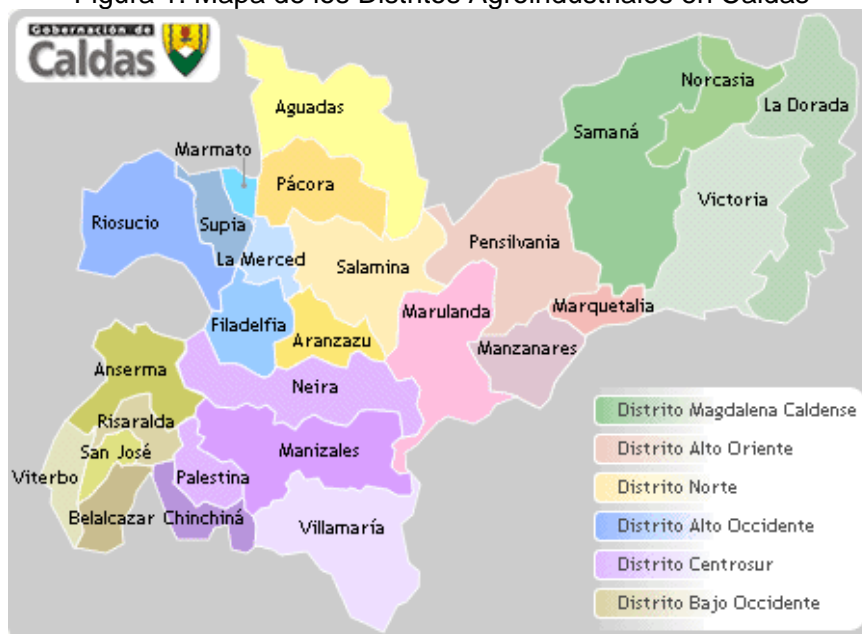
Figura 1: Mapa de los Distritos Agroindustriales en Caldas