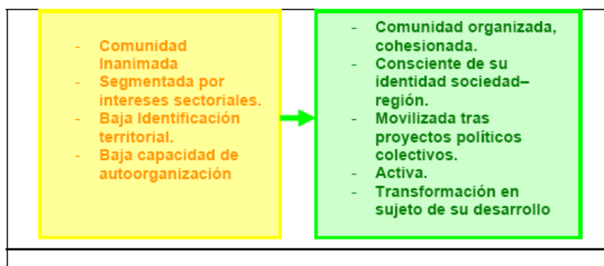
Figura 3. Transformación Región Sujeto