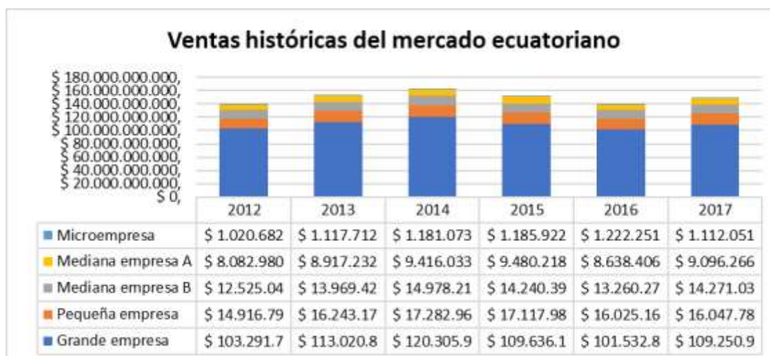
Gráfica 1. Ventas históricas del mercado ecuatoriano en las diferentes categorías de empresas (INEC, 2017)