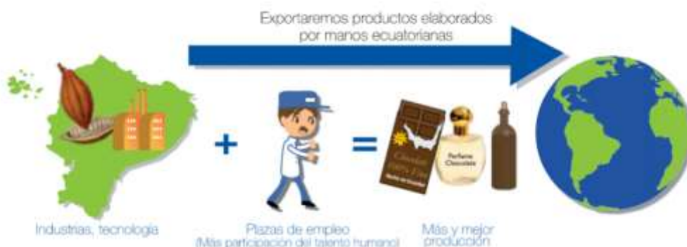
Figura 2: Matriz Productiva Actual