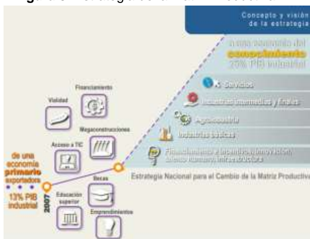
Figura 3: Estrategia de la Matriz Productiva