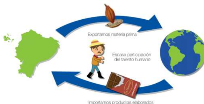
Figura 1: Matriz Productiva Histórica