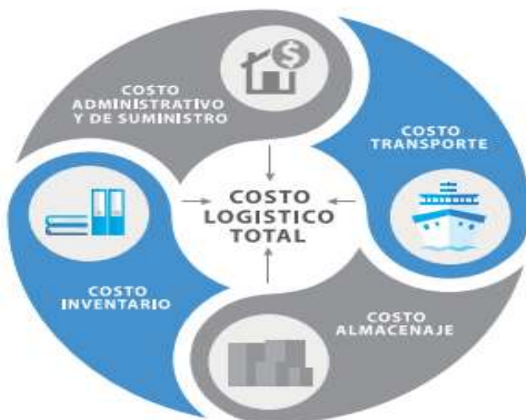
IMAGEN No. 1. Costos Logísticos