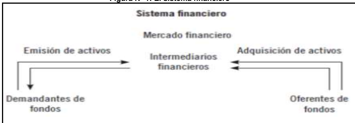
Figura Nº 1: El sistema financiero

Para lograr entender cómo funciona el sistema financiero y sus diferentes componentes, se va a mostrar, de forma esquemática y simple, la siguiente figura, que ayudará a su comprensión: (Montaño, 2014)