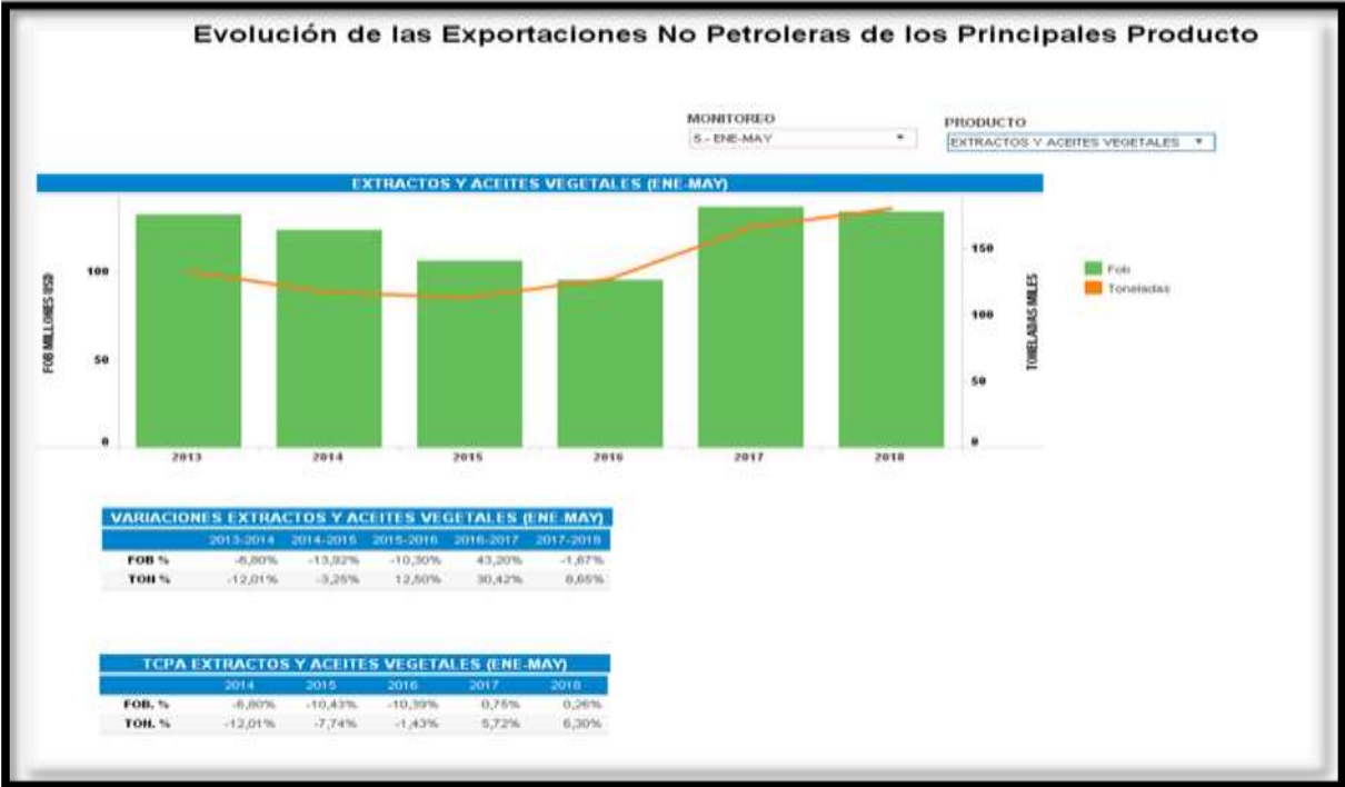
Gráfico 1.- Datos Estadísticos Exportaciones de los Extracto y Aceites Vegetales

En la tabla # 3 podemos observar que la partida arancelaria 151590.00 el aceite de aguacate extra virgen esta clasificado en los demás, esto quiere decir que la partida no corresponde solamente al producto mencionado y que posee una tarifa arancelaria del 20 %.