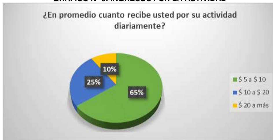
GRÁFICO N° 5: INGRESOS POR LA ACTIVIDAD

FUENTE: Encuestas realizadas a los niños, niñas y adolescentes del cantón Riobamba. ELABORADO POR: Los Autores