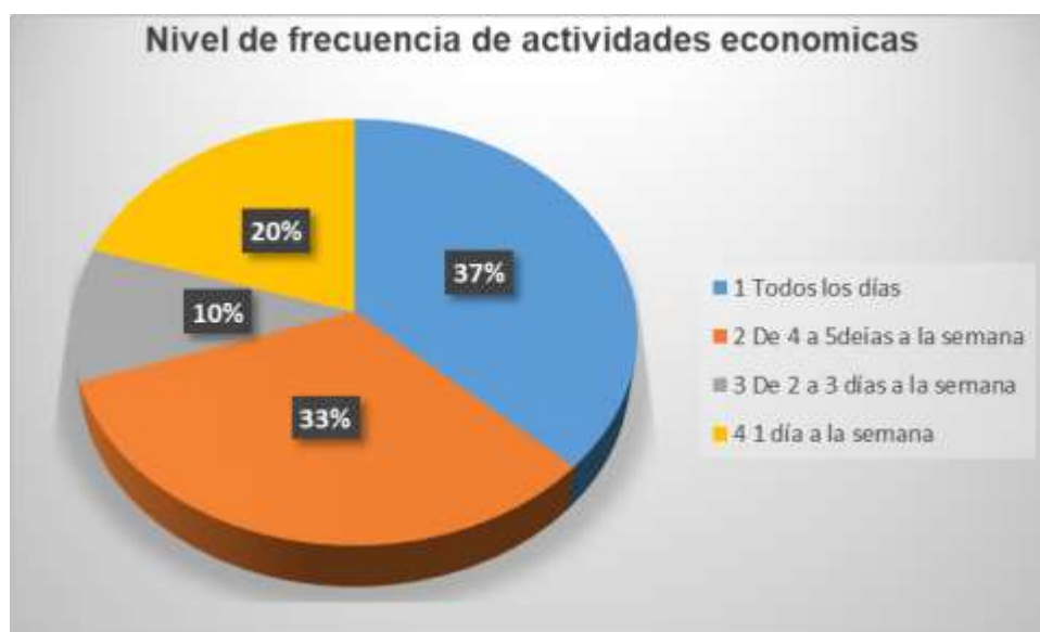
Grafico No 2: Nivel de frecuencia de actividades económicas