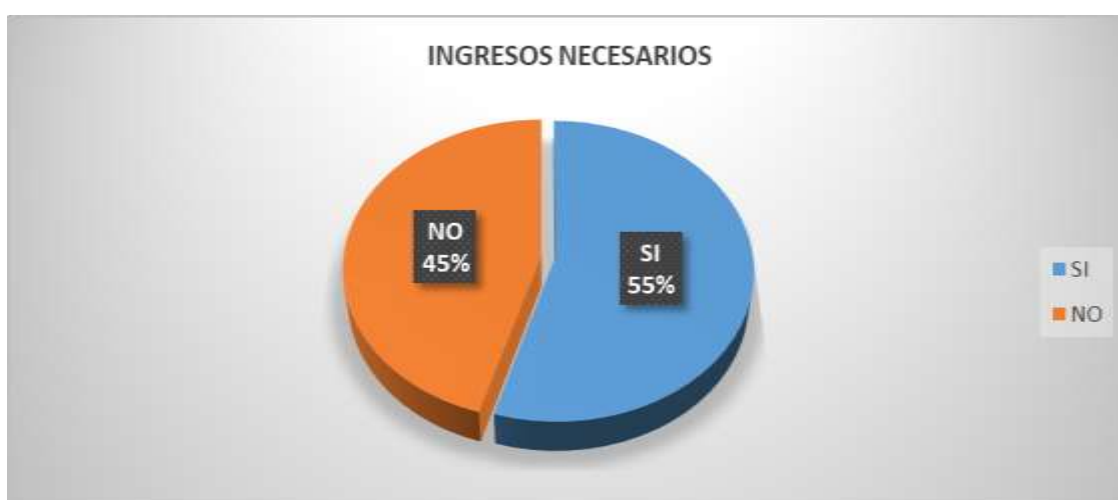
GRÁFICO No. 7 INGRESOS NECESARIOS