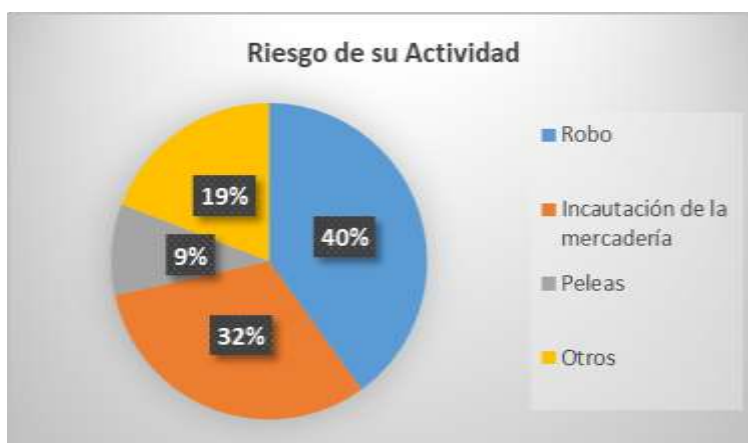
GRÁFICO N° 9: RIESGO DE SU ACTIVIDAD