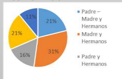
GRÁFICO N° 8 CONFORMACIÓN DE LA FAMILIA