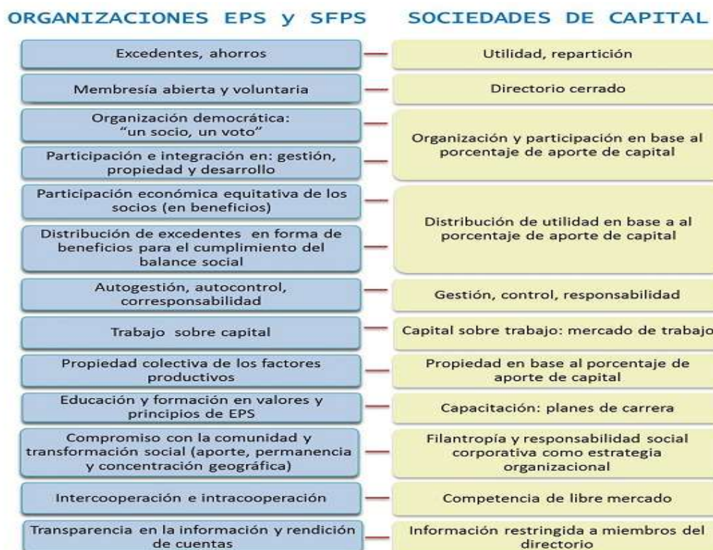
Figura 1. Análisis comparativo de los principios y características que permiten identificar a las organizaciones de la Economía Popular y Solidaria y del Sistema Financiero Popular y Solidario, y distinguirlas de las corporaciones privadas.