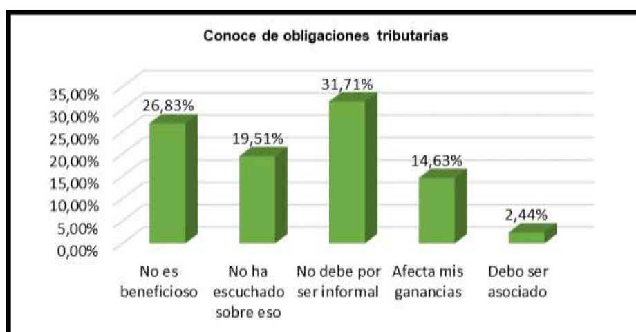
Gráfico 2. Conocimiento de obligaciones tributarias por cumplir

Análisis: En base a los resultados obtenidos de la encuesta efectuada, se concluye que casi un 74,55% de los encuestados manifestó que no conoce completamente de que tiene obligaciones tributarias por pagar (considerando las categorías de poco y nada conoce),