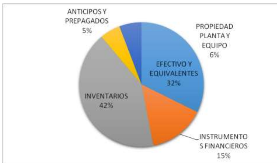
Grafico 2: Distribución Del Activo