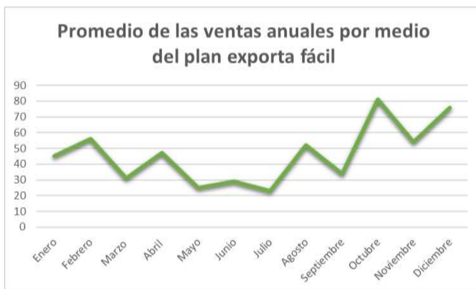
Figura 3 Promedio de las ventas anuales