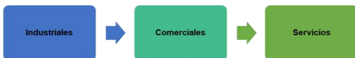
Figura 1 Clasificación de las PYMES