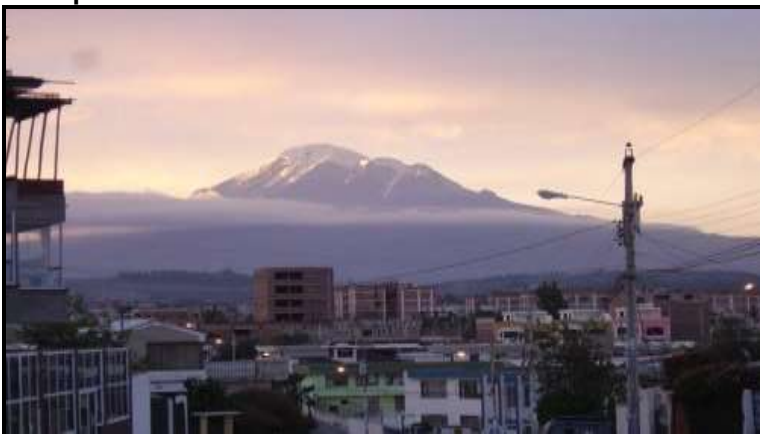
Presentado por: Juan Rendón Pérez