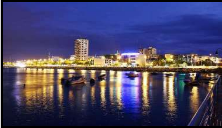
Presentado por: Guido Poveda Burgos