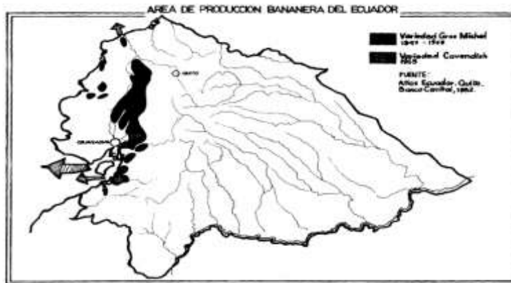
Ilustración 1- Área de Producción Bananera del Ecuador