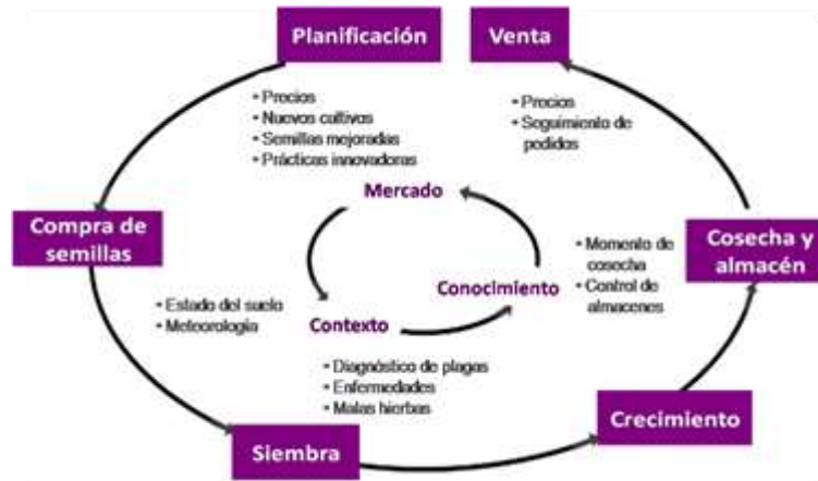
Figura 2. Necesidades de información a lo largo del ciclo agrícola