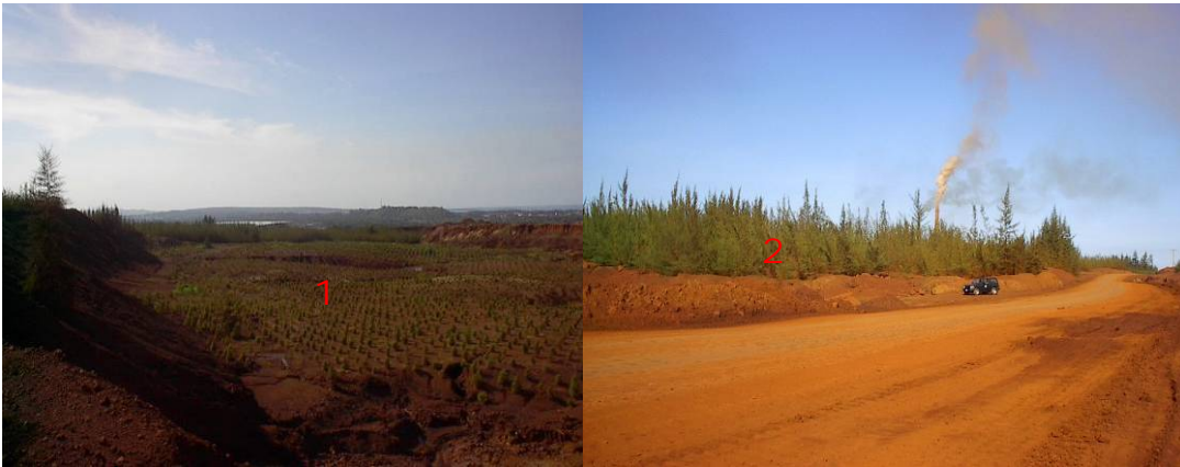
Figura 2. Áreas sembradas con Pinus cubensis (1) y Casuarina equisetifolia (2) (Fotos: Fuente propia).

En la fase de recultivación biológica las plantas utilizadas por las empresas mineras de Moa son: Casuarina equisetifolia (Casuarina), Calophyllum antillanum (Ocuje), Albizia lebbek (algarrobo de olor), Pithecellobium dulce (Tamarindo chino), Eucalyptus spp. (Eucalipto), Pinus caribaea (Pino macho), Pinus cubensis (Pino), Anacardium occidentale (Marañón), Psidium guajaba (Guayaba). Las especies Pinus cubensis y Casuarina equisetifolia han sido las más usadas y las de mayor capacidad de supervivencia y adaptación (Figura 2).