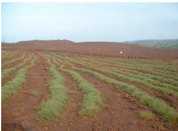
Figura 6. Método de Barreras vivas.

El uso de las Barreras vivas tuvo la misma función que la Cobertura de gramíneas pero con la diferencia que se aplicó en taludes y suelos de pendientes moderadas y fueron efectivas a mediano plazo ya que a medida que pasa el tiempo se van acumulando los sedimentos frente a las barreras de las especies herbáceas sembradas, permitiendo esta acumulación la formación de terrazas.