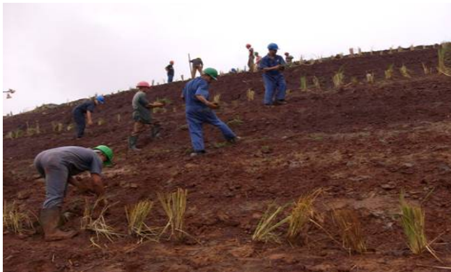
Figura 5. Método de Coberturas de gramíneas en laderas y taludes.

La experimentación con las especies de porte herbáceo en pequeñas áreas de las zonas minadas, resultó una rehabilitación efectiva a corto plazo, garantizando la fijación del suelo a través del recubrimiento total de la superficie con cobertura vegetal; para lo cual se sembraron gramíneas en laderas y taludes (Figura 5) y barreras vivas con otras especies herbáceas (Figura 6). Las coberturas de gramíneas disminuyeron la erosión superficial en terrenos de pendiente variable al disipar la escorrentía superficial en los taludes, reducir la velocidad del flujo hídrico y capturar el material erosionado; por lo que esta variante resultó eficaz para estabilizar los suelos y lograr un impacto significativo en el paisaje a corto plazo.