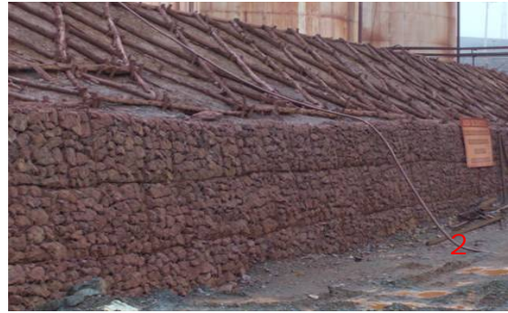
Figura 4. Obra de ingeniería: Dique combinado con postes de madera y rocas (1) y Método de Barreras de ramas (2).

La experimentación con las especies de porte herbáceo en pequeñas áreas de las zonas minadas, resultó una rehabilitación efectiva a corto plazo, garantizando la fijación del suelo a través del recubrimiento total de la superficie con cobertura vegetal; para lo cual se sembraron gramíneas en laderas y taludes (Figura 5) y barreras vivas con otras especies herbáceas (Figura 6). Las coberturas de gramíneas disminuyeron la erosión superficial en terrenos de pendiente variable al disipar la escorrentía superficial en los taludes, reducir la velocidad del flujo hídrico y capturar el material erosionado; por lo que esta variante resultó eficaz para estabilizar los suelos y lograr un impacto significativo en el paisaje a corto plazo.