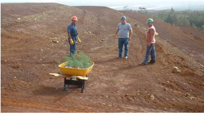
Figura 1. Método de Terraza.

En la fase de recultivación biológica las plantas utilizadas por las empresas mineras de Moa son: Casuarina equisetifolia (Casuarina), Calophyllum antillanum (Ocuje), Albizia lebbek (algarrobo de olor), Pithecellobium dulce (Tamarindo chino), Eucalyptus spp. (Eucalipto), Pinus caribaea (Pino macho), Pinus cubensis (Pino), Anacardium occidentale (Marañón), Psidium guajaba (Guayaba). Las especies Pinus cubensis y Casuarina equisetifolia han sido las más usadas y las de mayor capacidad de supervivencia y adaptación (Figura 2).