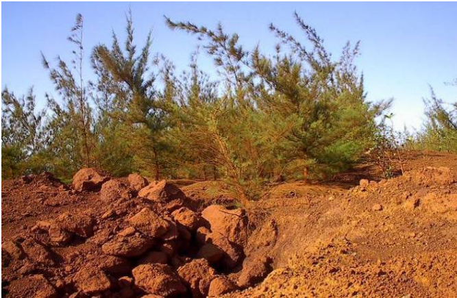
Figura 3. Área rehabilitada con Casuarina equisetifolia , donde se observa la formación de cárcavas.

En este último punto, tenemos que referirnos a la siembra con la Casuarina, que aunque algunos autores (GEIGEL, 1980; NODA, 1990; HERRERO, 1995; BRUZÓN et al. , 2000, 2004) refieren el uso de esta especie en la rehabilitación debido a que es conocida por sus propiedades como mejoradora de suelo y su plasticidad ecológica, en ninguna de las áreas rehabilitadas por las empresas mineras de Moa ha contribuido a la formación de una capa de suelo enriquecida u óptima para sembrar otras especies de mayor requerimiento biológico, tampoco evita de una forma efectiva la erosión y por ende la formación de cárcavas (Figura 3); lo cual difiere con lo planteado por TORRES et al. (2002) de que las plantaciones artificiales utilizadas en la reforestación de las áreas mineras explotadas de Moa, en particular el caso de Casuarina equisetifolia , contribuyen a detener los procesos erosivos.