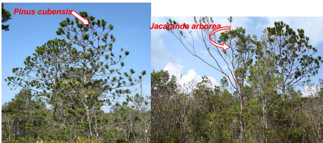
Figura 10. Pinus cubensis y Jacaranda arborea , especies arbóreas que se recomiendan para la recultivación biológica.

Las especies recomendadas persisten en zonas altamente afectadas por la minería (camino mineros, trochas, perforaciones geológicas, extracción de madera, entre otras), y a la vez, la introducción de éstas garantizaría una rehabilitación heterogénea y rica en especies propias del lugar.