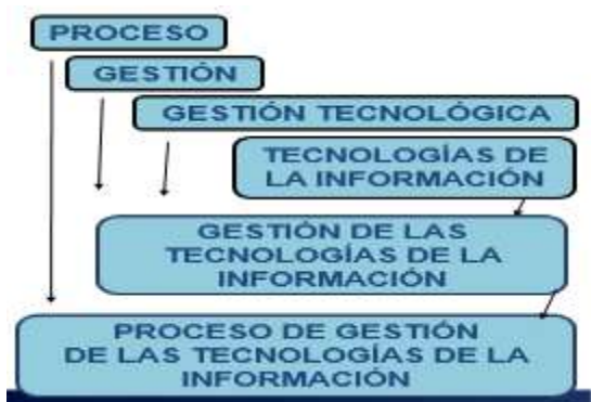
Figura 1. Tratamiento de los conceptos esenciales de la gestión de las tecnologías de la información

Para conocer las categorías terminológicas en este campo resultó imprescindible una descomposición para regresar entonces de lo general a lo particular, comenzando por el concepto de tecnología , que se abordará más adelante.