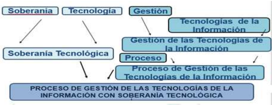
Figura 3. Tratamiento de los conceptos esenciales del proceso de gestión de las tecnologías de la información con soberanía tecnológica

Finalmente, sólo resta relacionar los conceptos esenciales del proceso de gestión de las tecnologías de la información con soberanía tecnológica, tal y como se muestran en la figura 3. Con este proceso se intenta materializar las medidas para enfrentar los riesgos de no observar la soberanía tecnológica en la gobernanza y la gestión estatal de las tecnologías de la información.