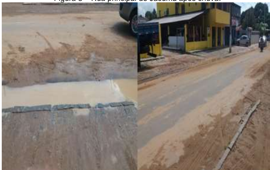
Figura 3 – Rua principal de Jacumã após chuva.

A taxa de domicílios urbanos em vias com urbanização adequada em Conde é de apenas 1%. Além disso, devido à inexistência de galerias pluviais, as ruas ficam alagadas e sujas após chuvas (Figura 3). Há, ainda, ligações irregulares de esgoto não tratado, despejado diretamente no mar.