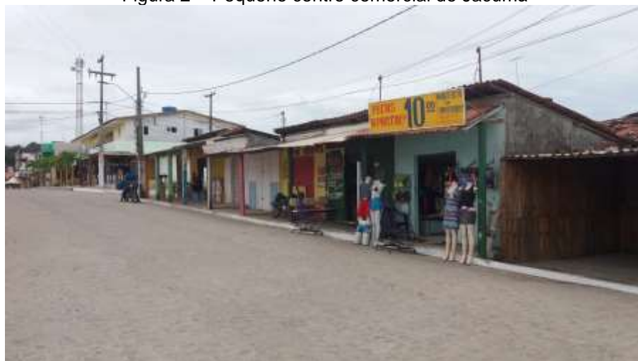
Figura 2 – Pequeno centro comercial de Jacumã

Próximo à praia há um pequeno centro (Figura 2) composto por estabelecimentos comerciais e de serviços, entretanto é notável a ausência de agência bancária de qualquer banco em Jacumã, o que causa dificuldades a moradores e turistas.