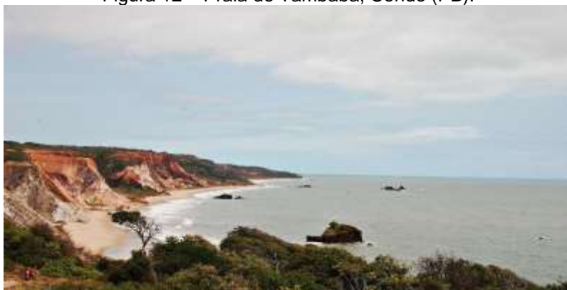
Figura 12 – Praia de Tambaba, Conde (PB).

A praia de Tambaba carrega a distinção de ser uma praia naturista, sendo a única desse tipo no litoral da Paraíba. A área dedicada à prática exclusiva do naturismo é limitada a um trecho da praia, sendo sinalizada com placa. No trecho restante, a prática do naturismo é opcional, mas notamos que a maioria das pessoas que frequentam esse trecho no qual é opcional a prática do naturismo, optam por não o fazer (Figura 12).