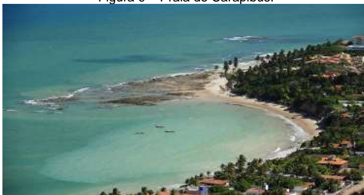
Figura 9 – Praia de Carapibus.

A Praia de Carapibus possui orla aberta e apresenta a formação de maceiós e falésias, além de uma área de mangue. Dotada de beleza cênica (Figura 9), atualmente, a praia passa por processo de urbanização e já há alguns bares, restaurantes e pousadas próximos à praia. Além disso, há um loteamento onde, pouco a pouco, começam a surgir residências de veraneio. Nota-se, entretanto, que a praia de Carapibus ainda não conta com abastecimento de água, sendo as necessidades hídricas supridas por meio de poços artesianos. Há, também, uma pequena comunidade caiçara, cujos membros desenvolvem pesca artesanal.