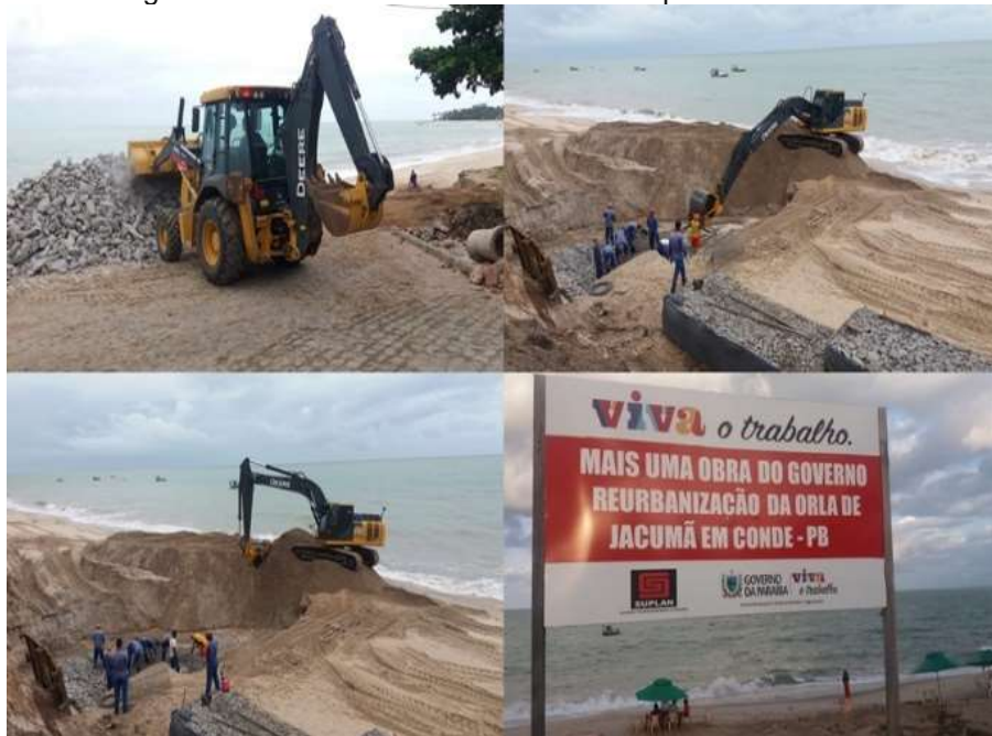
Figura 4 – Obras estruturais em curso na praia de Jacumã.