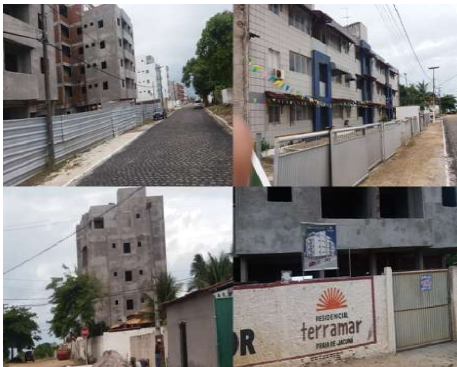
Figura 6 – Residenciais verticais recém-inaugurados ou em obras em Jacumã.

Desde o anúncio do conjunto de obras pelo governo da Paraíba, o valor do m 2 médio em Jacumã tem aumentado. Concomitantemente às obras estruturais que vêm sendo realizadas, tem ocorrido também um processo de verticalização habitacional, principalmente nas ruas próximas à praia, o que tem gerado processo de especulação imobiliária e adensamento urbano (Figura 6).