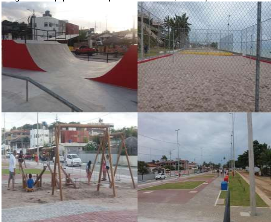
Figura 5 – Equipamentos esportivos e de lazer, orla da praia de Jacumã.

As obras estruturais (galerias pluviais e calçamento) que estão sendo realizadas contemplam, ainda, equipamentos de prática esportiva e de lazer que ficarão à disposição da população local e dos turistas. Foram construídas, uma quadra de futebol de areia, uma quadra poliesportiva, uma pista de skate e um playground (Figura 5).