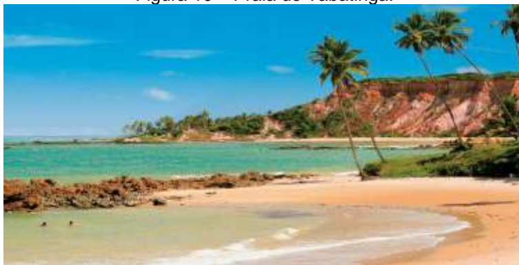
Figura 10 – Praia de Tabatinga.

A Praia de Tabatinga (Figura 10) possui orla aberta, com leve concavidade, entremeada por fozes (do rio Bucatu, do maceió Paratibe e do riacho Tabatinga). O relevo da praia é levemente acidentado, marcado por formações calcárias e arrecifes areníticos, além de uma estreita área de falésias.