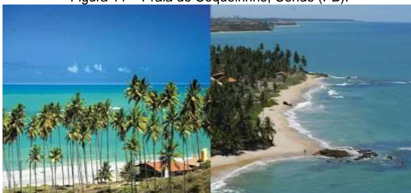
Figura 11 – Praia do Coqueirinho, Conde (PB).

A praia do Coqueirinho, é constituída por um planalto costeiro, entremeado por falésias, próximas à faixa de areia da praia, mais estreita ao norte que ao sul. Há presença de alguns córregos que deságuam no mar e também há um trecho pequeno de manguezal. Como o nome da praia sugere, toda sua extensão possui coqueiros que garantem sombra constante na faixa de areia da praia (Figura 11).