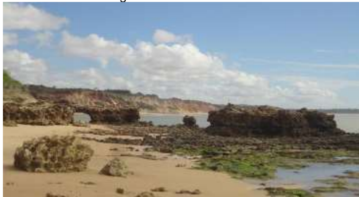
Figura 8 – Praia do Amor.

A Praia do Amor apresenta trecho de falésias e um conjunto de formações calcárias – destaque para a Pedra Furada (Figura 8), cartão postal da praia – ao lado de um manguezal, adjacente à foz do rio Gurugi.