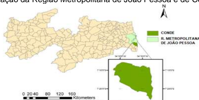
Figura 1 – Localização da Região Metropolitana de João Pessoa e de Conde na Paraíba.

Na divisão administrativa brasileira de 1911, a Vila do Conde tornou-se distrito de Conde, parte da “Cidade da Parahyba” (que posteriormente receberia o nome de João Pessoa). Conde somente viria a ser emancipado como município em 1963. Atualmente, o município de Conde (Figura 1) faz parte da Região Metropolitana de João Pessoa (PB), estando localizado a cerca de 20 quilômetros ao sul da capital do estado.