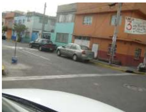
Fig. 2.- Esquina Julia y Luís