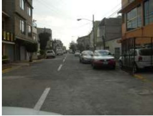
Fig 3. Calle Mario

Hasta hoy el 100% de las calles están pavimentadas. Electrificación en un 100%. La comunicación es optima, combis, al Metro Pantitlán y la estacion de la línea A del tren ligero. Las principales vías de acceso a esta son: la Avenida Texcoco que divide el Estado de Mexico y el DF, y la avenida Pantitán con una gran afluencia vehicular.