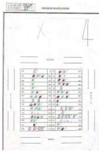
Fig 1. Croquis de Manzana. Calle Mario

Las familias que habitan en vecindades son las que presentan mayores problemáticas.