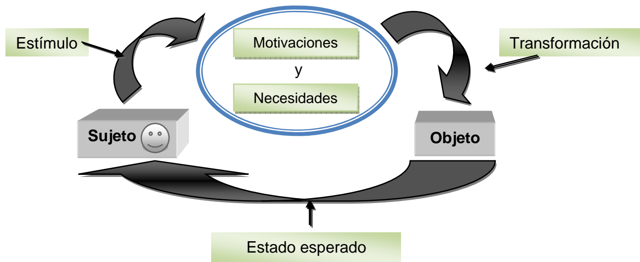
Diagrama 1. Relación Sujeto – Objeto.

La relación sujeto – objeto puede estar medida a rasgos particulares del grado de persecución, comprensión y desarrollo de todo lo que nos rodea, por ejemplo, la cultura, la personalidad, medio ambiente, la comunicación, entre otros. (Ver Diagrama 1.)