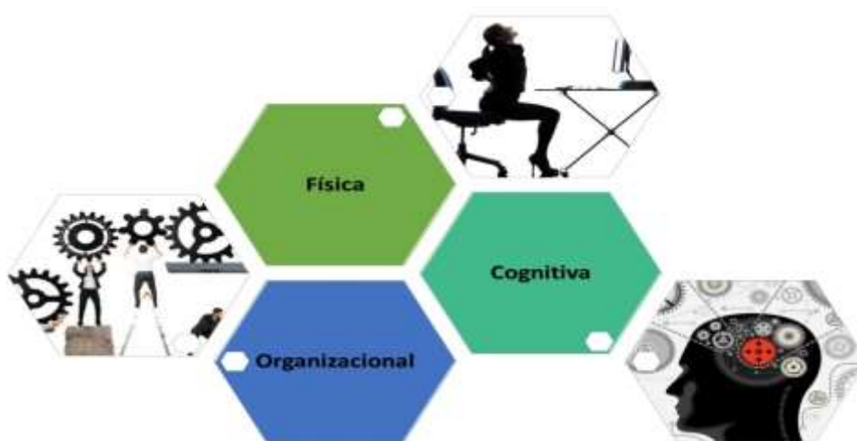
Figura 1: Análise Ergonômica do Trabalho

Podemos perceber então que os fatores ergonômicos dentro de um DP influenciará no quesito, limitação física e até mental dos colaboradores, colaborando na agilidade e praticidade na realização das tarefas do setor.