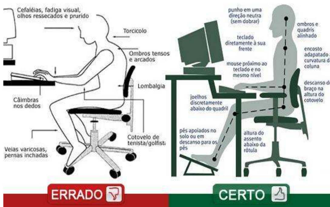
Figura 2: A influência positiva da ergonomia

Na figura 1, podemos observar alguns fatores ergonômicos que interferem nas habilidades dos trabalhadores, ao se fazer as devidas modificações, físicas, cognitivas e organizacionais no ambiente de DP, os colaboradores poderão ter garantidas a saúde e a segurança no ambiente de trabalho, refletindo assim na estabilidade produtiva da organização.