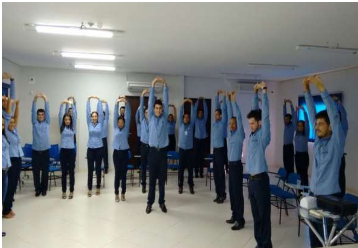
Figura 3: Ginástica Laboral 6

Os benefícios que esses alongamentos podem oferecer são inúmeros, e podem facilitar o dia a dia dos funcionários de DP quando se diz respeito à diminuição do estresse físico e mental produzido dentro deste setor que trabalha diariamente com as exigências de um mercado sempre mudando, mas nunca deixando de lado as exigências dos prazos extremamente apertados.