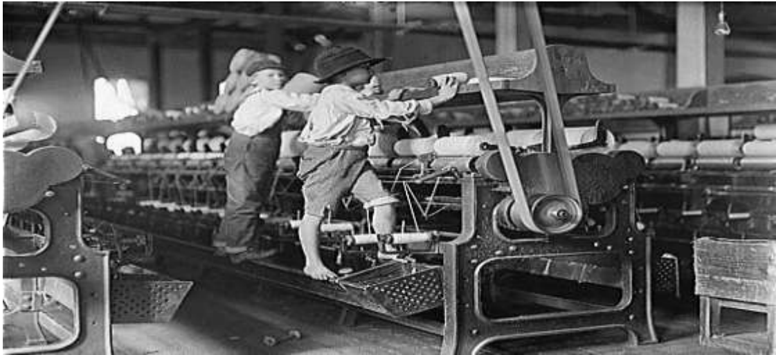
Figura 1 – Trabalho infantil na Revolução Industrial

A origem da ideia de qualidade de vida no trabalho teve início em 1950, com o surgimento do questionamento sociotécnico, que se trata de um questionamento sobre a organização do trabalho que enxerga uma relação entre o funcionário e as tecnologias de seu ambiente de trabalho.