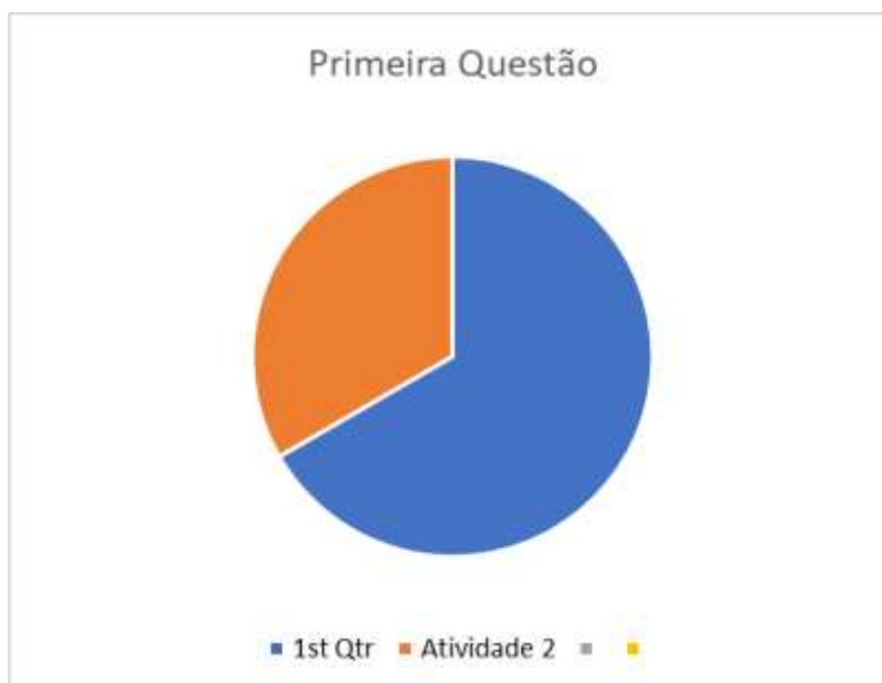
Gráfico ( Pie ) referente aos resultados encontrados na primeira pergunta.

Neste tópico do trabalho, serão comentados os resultados encontrados nos três questionários, os quais foram compostos por 4 questões, onde o aluno escolhia opções e marcava, mas, logo após, ele teria que escrever sobre o que ele teria escolhido, basicamente, justificando sua resposta. Para cada questão apurada, haverá aqui um gráfico ( Pie ) seguido de comentário.