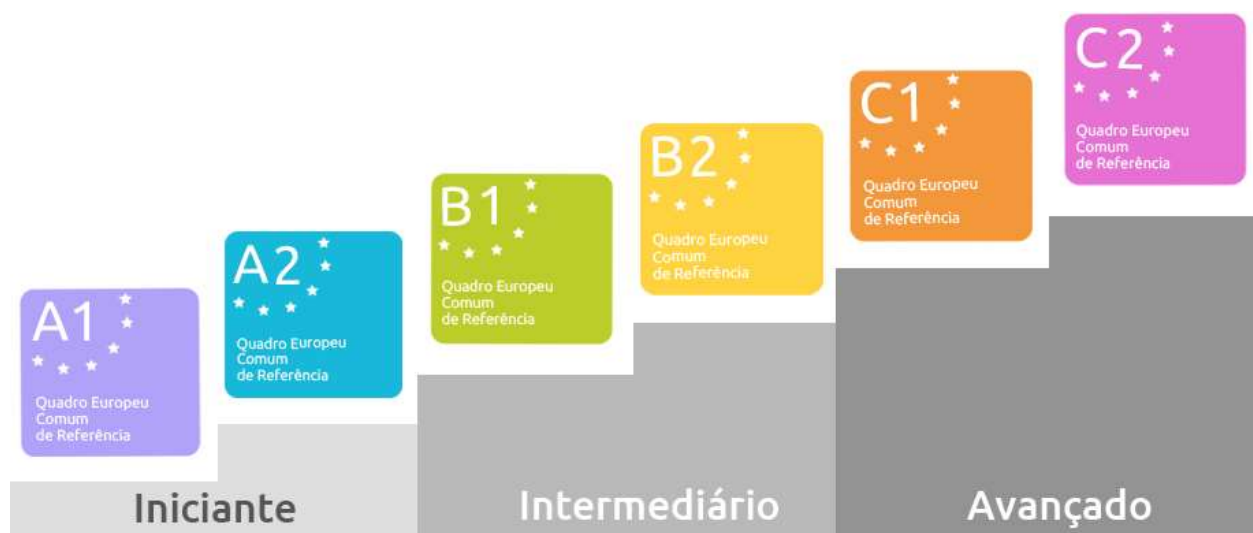
Figura 1 – Níveis de Aprendizado em Inglês.

Como já citado antes no presente trabalho, além da importância de transmissão de conhecimentos culturais, o Reader também é de grande valia para os aprendizes de língua Inglesa, pois os livros são produzidos com vocabulários e estruturas gramaticais de acordo com os níveis. Os níveis de aprendizado de língua Inglesa, de acordo com o CERF , crescem do A1 (básico) ao C2 (proficiente), segue imagem abaixo apresentando um pouco melhor o gráfico sobre a língua Inglesa: