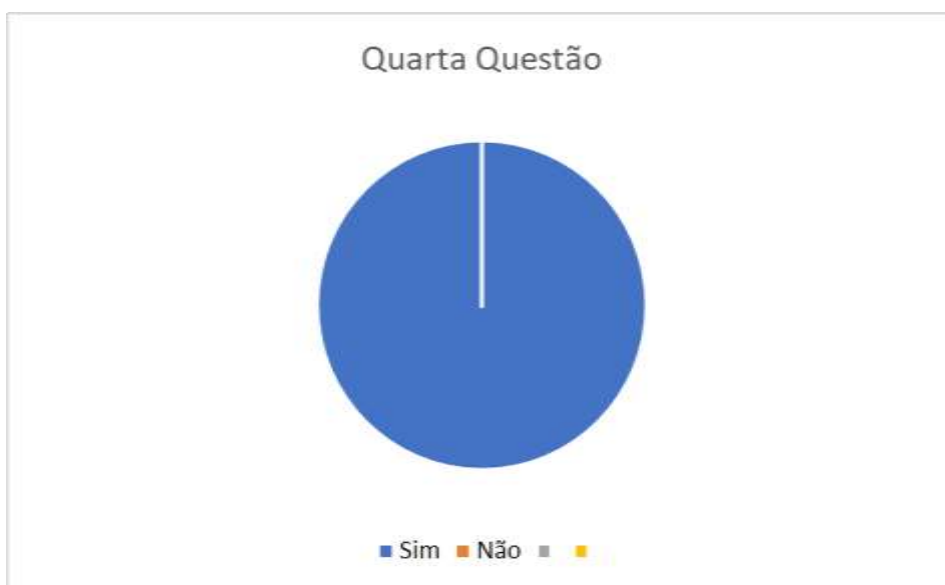
Gráfico (Pie): Respostas encontradas como resultados da quarta questão.