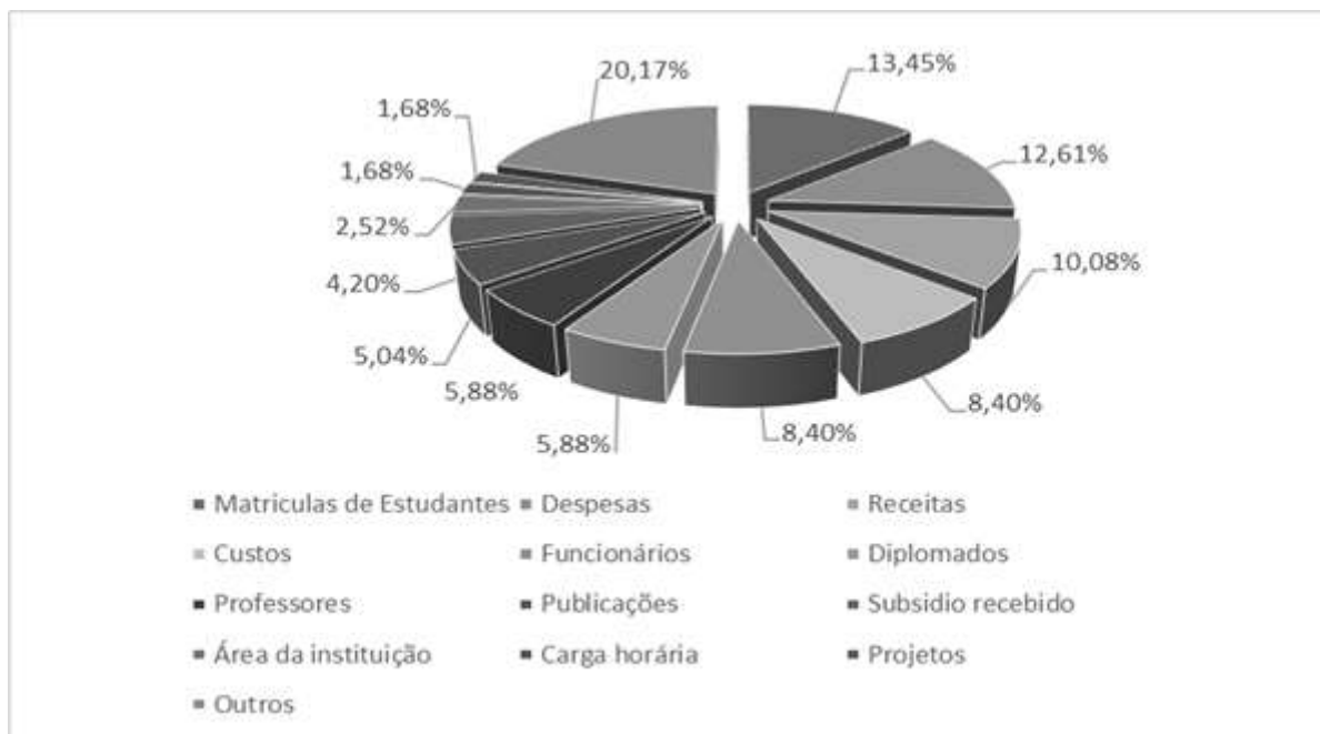
Figura 3 - Variáveis identificadas no PB e o percentual de aplicação nas pesquisas.