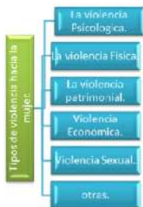
Figura 1. Tipos de violencia hacia la mujer (Artículo 6 Ley General de Acceso a las Mujeres a una Vida Libre de Violencia).

A continuación, vamos a realizar una breve explicación acerca de los tipos de violencia que se contempla en el artículo 6 de la Ley General de Acceso a las Mujeres a una Vida Libre de Violencia.