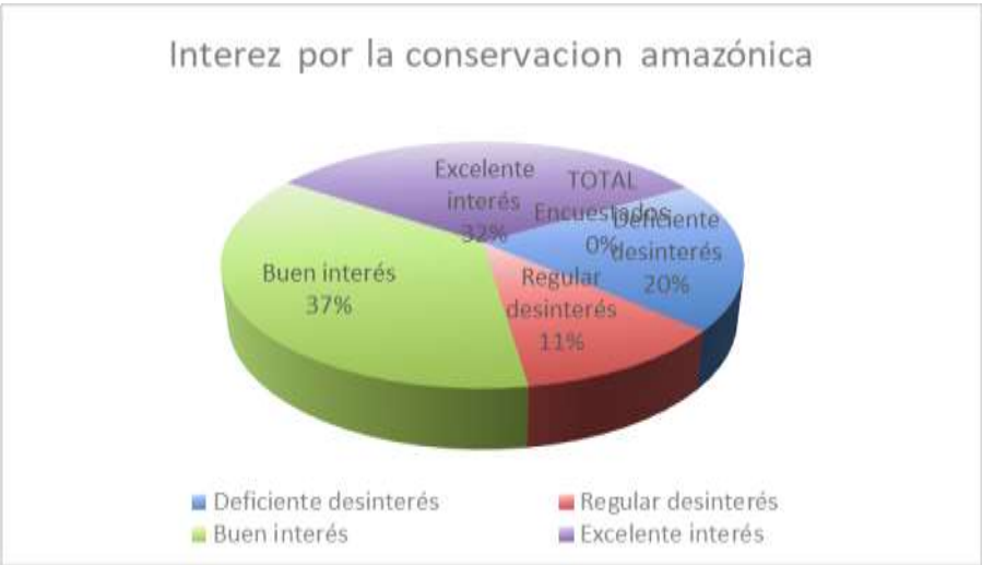
Grafico II.- Interés por la conservación amazónica ANTES del recorrido de turismo científico del CIPCA.