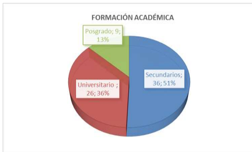
Grafico I. Formación Académica de los visitantes

Según el grafico I. de formación académica de los visitantes que fueron objeto de la investigación, da como resultado, que el número mayor de visitas fueron los visitantes con nivel de estudios secundarios, con 36 visitantes que corresponde al 51%; le sigue los visitantes universitarios que con 26 visitas le corresponde el 36%, y por último los visitantes con formación de posgrado ya sean magister y doctores, los mismos que con 9 visitas le corresponde el 13%.