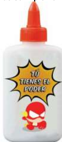
Figura 5. Artículo donde se implementará la campaña