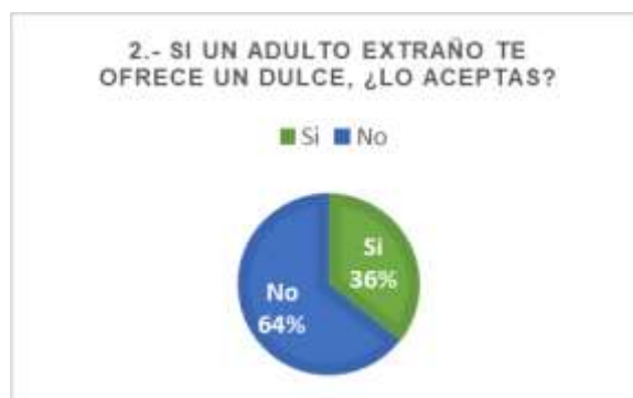
Figura 2. Recibir dulces de un extraño

de personas extrañas, las cuales pueden tener intenciones malas con el niño, razón por la cual es necesario reforzar mediante una campaña, información básica e importante para la prevención de abuso sexual infantil y cuidado.