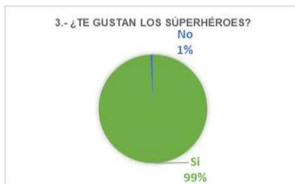
Figura 3. Cuadernos y útiles escolares

Se preguntó a los estudiantes si les gustan los superhéroes, en la actualidad los superhéroes son personajes que atraen mucho a los niños, razón por la que se le realizó esta pregunta con la finalidad de confirmar su aceptación, la cual fue positiva con un 99%. De esta manera se decide realizar con los diferentes superhéroes existentes la campaña para que tenga mayor impacto en los niños.