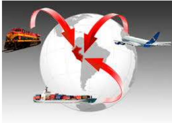
Figura 1 Importaciones