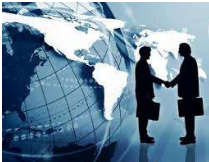
Figura 3 Negocios

El negocio internacional, tal como lo indica su nombre, son el conjunto de transacciones que se realiza entre 2 o más países. Se puede deducir que el negocio internacional abarca exportaciones e importaciones, así como financiamientos e inversiones. No obstante, cada país contiene su regulación jurídica para establecer la forma y los requisitos para llevar a cabo el intercambio internacional de bienes y servicios.