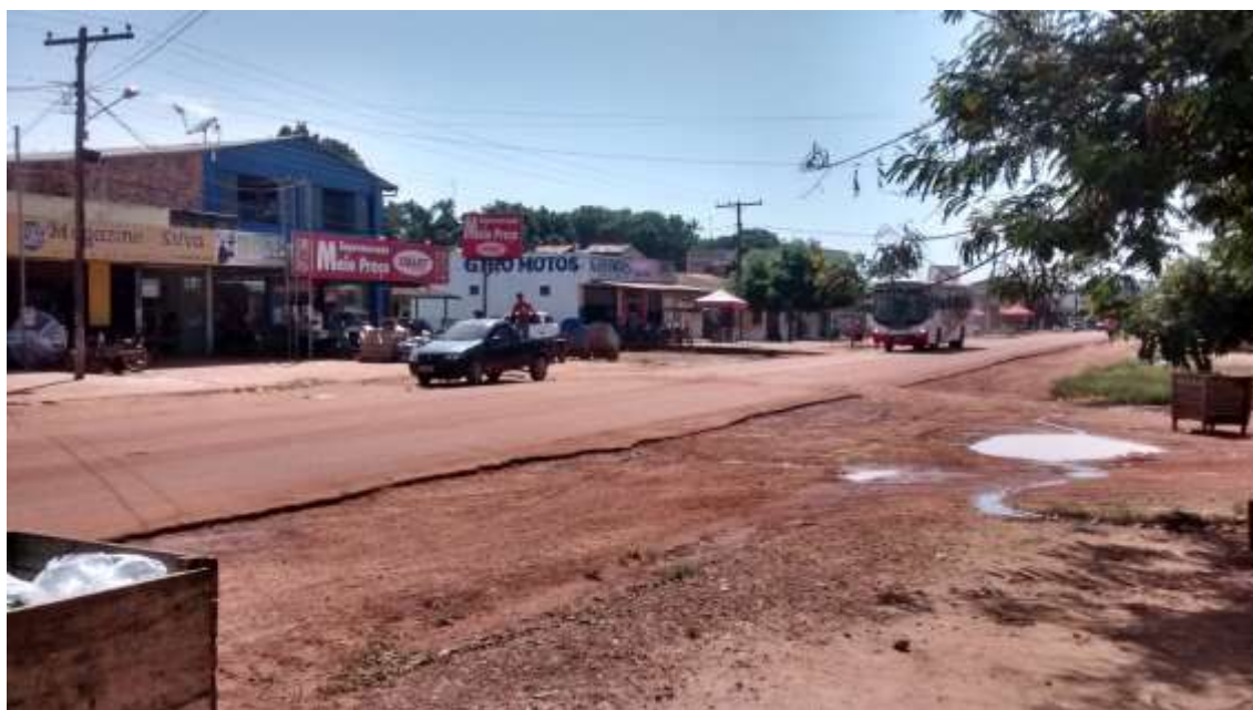
IMAGEM 2- Principal via comercial.

Como podemos observar na imagem 2, a baixo, a rua Francisco Luís, onde se localiza a avenida principal de comércio na vila Forquilha, com vários estabelecimentos comerciais, entre eles o supermercado chamado “Meio Preço”, o de maior referência na vila, e o “Giro Motos”, que oferece serviços de manutenção de motos e a venda de acessórios. Além disso, temos a presença de um ônibus da empresa Biopalma, que faz o transporte dos trabalhadores, das áreas de plantio da empresa até as vilas ao redor. Na vila Forquilha não há um sistema de transporte público que transite pelas ruas, há apenas duas linhas, uma da empresa Calimã e outra da Boa Esperança que passam pela vila uma ou duas vezes por dia. Contudo o transporte alternativo se faz presente, mesmo não sendo legalizado transporta os moradores até Quatro Bocas e o centro de Tomé-açu.