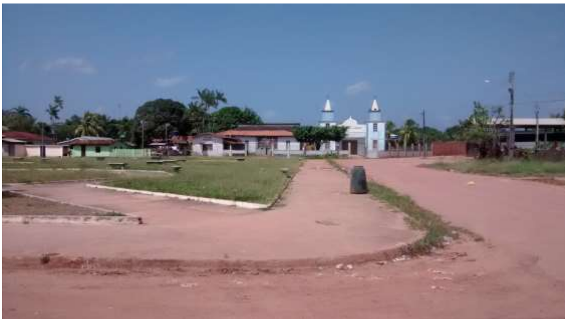
IMAGEM 3- A Igreja e a Praça central.

Observamos ainda que algumas moradias preservam plantios e tem nos quintais arvores de médio porte, que esboçam a resistência do lugar as transformações. Algumas propriedades mais afastadas da área comercial da vila Forquilha que possuem seus roçados, aderiram ao sistema de parceria e cultivam dendê. A presença dos postes de energia elétrica, como iluminação pública, casas com sistemas de água encanada, caixas d'água. As áreas de mata virgem que cada agricultor preserva ainda dão um "ar verde" a paisagem da Vila Forquilha.