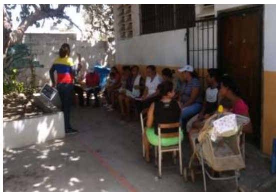
ILUSTRACIÓN 2. PROCESO DE FORMACIÓN PERMANENTE A LOS VIVIENDO VENEZOLANOS.