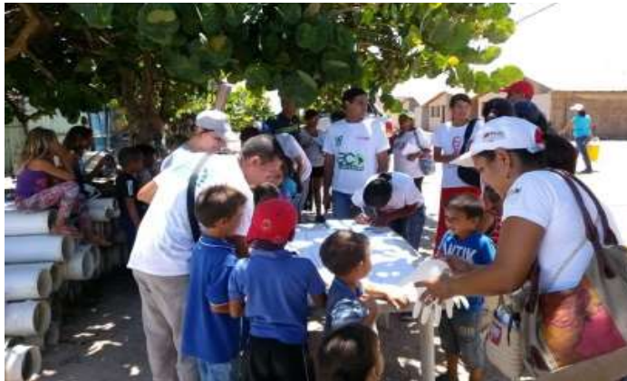
ILUSTRACIÓN 4. PROCESO DE FORMACIÓN Y ATENCIÓN PERMANENTE A LA BRIGADA DE PEQUEÑOS GUARDAPARQUES.

Fuente: Muestra Investigada. Curso de muralismo impartido por el Frente Francisco de Miranda, Nueva Esparta, octubre 2015.