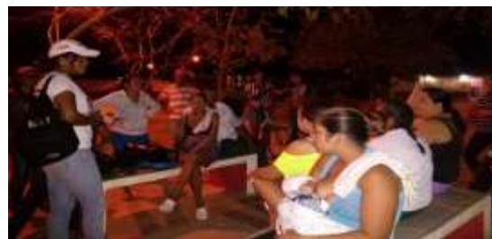
ILUSTRACIÓN 3. JORNADA ACTITUD CHÁVEZ. CONSEJOS COMUNALES DE CHACACHACARE

Fuente: Muestra Investigada. Octubre 2015. Comunidad Chacachacare, Nueva Esparta