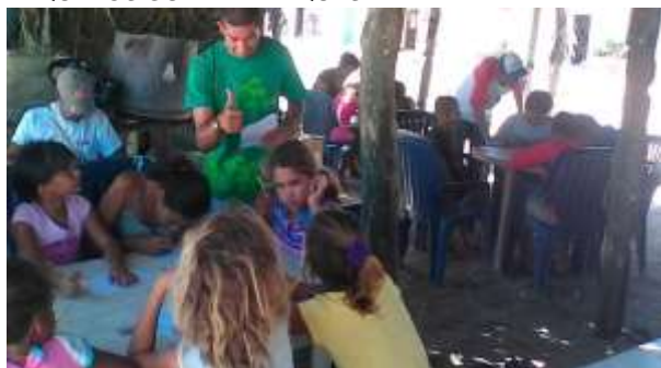
ILUSTRACIÓN 5. CURSO DE MURALISMO A BRIGADA PEQUEÑOS GUARDAPARQUES.