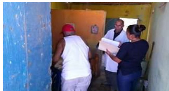
ILUSTRACIÓN 6. CASA A CASA DE LA MISIÓN BARRIO ADENTRO.

Fuente: Muestra Investigada, durante Jornada de Atención Integral por las Misiones Sociales, septiembre 2015. La Restinga, Nueva Esparta.