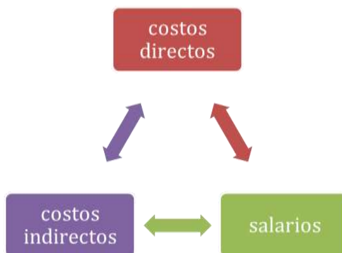
Ilustración 3 Tres grandes rubros los gastos