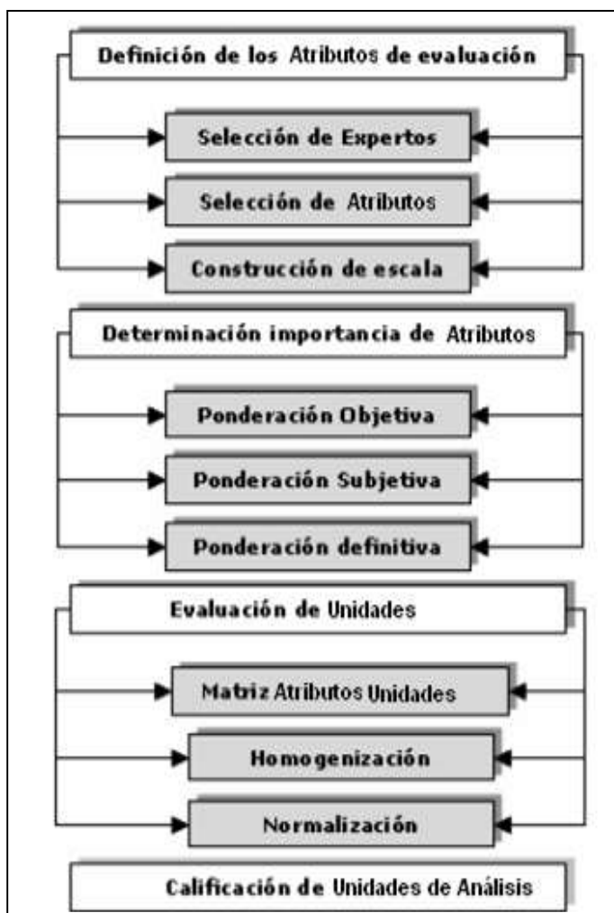
Figura 3: Tratamiento de los atributos de medición.