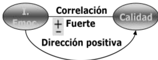
Figura 1: Relación entre IE y calidad percibida.