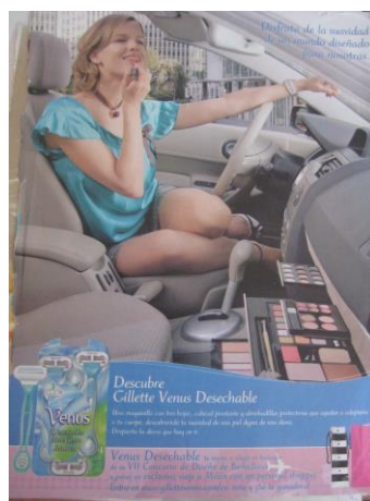
Fig.5: Gillette Venus desechable

Disfruta de la suavidad de un mundo diseñado para nosotras Una maquinilla con tres hojas, cabezal pivotante y almohadillas protectoras que ayudan a adaptarse a tu cuerpo, descubriendo la suavidad de una piel digna de una diosa. Despierta la diosa que hay en ti.