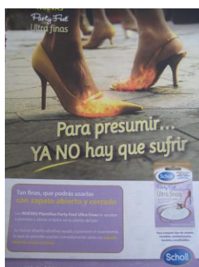
Fig.4: Party feet ultrafinas

completa con la frase “para presumir...ya no hay que sufrir”, dicho popular relacionado desde siempre con la coquetería y belleza femenina que se encorsetaba o calzaba tacones imposibles simplemente para gustar al hombre.