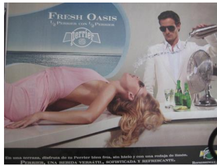
Fig.1: Fresh Oasis Perrier