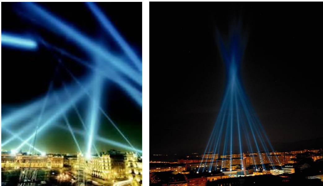
Rafael Lozano Hemmer: “Alzado Vectorial” (1998)

Rafael Lozano Hemmer nos lo muestra en su obra “Alzado Vectorial”, en la cual, utilizando un interfaz de simulación tridimensional, este sitio web permitió a los internautas diseñar una escultura de luz con 18 cañones antiaéreos localizados alrededor de la plaza. A cada participante se le hizo una página web con fotos de 4 cámaras digitales para documentar su diseño.