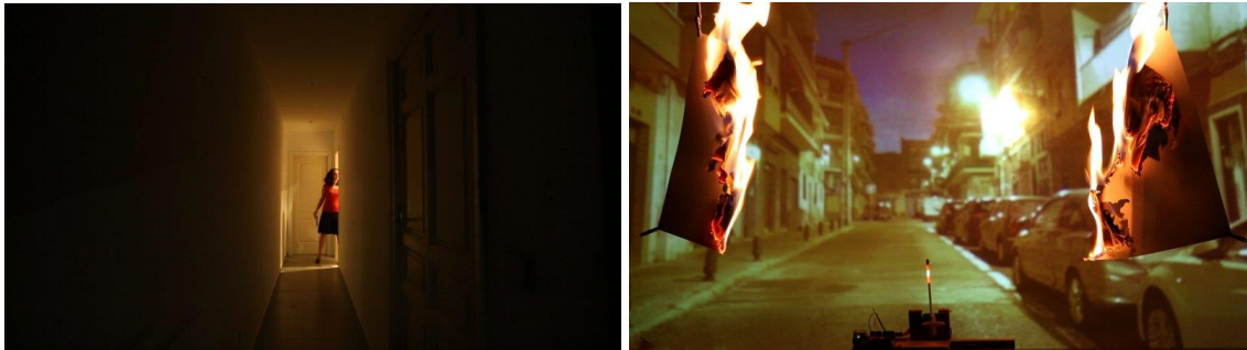
OVERFLOW, 2013. INTACT Project

representación, haciéndolo corpóreo y, por el otro, la capacidad de los sistemas telemáticos para crear productos artísticos (video creación) fuera del arte efímero.