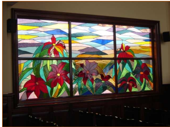
Proceso de restauración de un vitral del Paraninfo de La Universidad de La Laguna. Vitral emplomado en el Salón del Pleno del Realejo. Diseño de Carmen León

¿En Canarias dónde podemos encontrar ejemplo de vidrieras, lucernarios lámparas confeccionadas o restauradas por Vitrales con Luz?