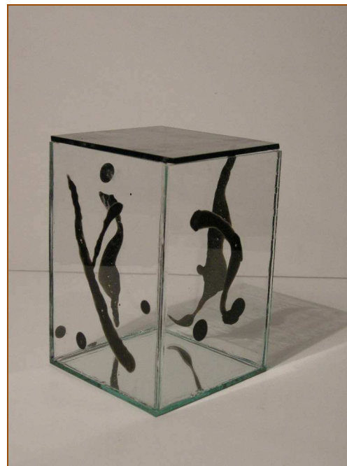
Escultura en vidrio. Piezas de las series “Estructuras con Luz” y “Pigmentos volcánicos”

Como creadora, dirías que tu obra ha experimentado un proceso evolutivo, o bien concibes cada pieza -o cada serie- de modo autónomo, como casos individuales que conllevan de por sí un desarrollo independiente.