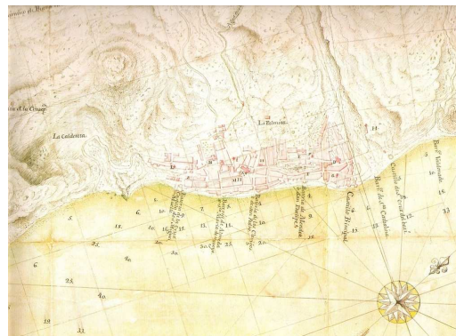
Detalle del plano de Santa Cruz de La Palma. Antonio Riviere. 1742

Este olvidado episodio histórico, si bien no influiría determinadamente en el desarrollo de la guerra en curso, a nivel local si que marcaría un hito en las vidas de quienes lo sufrieron, quizás llegándose a convertir en el acontecimiento más importante que les tocó vivir. Consideramos que esta historia de valentía y unión ante la adversidad es merecedora de ser recordada y por tanto la hemos convertido en el acto principal de nuestra asociación, efeméride de la que se cumple el 270 aniversario en junio de 2013.