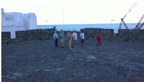
Inicios de la instrucción en el Castillo de Santa Catalina (mayo de 2012).