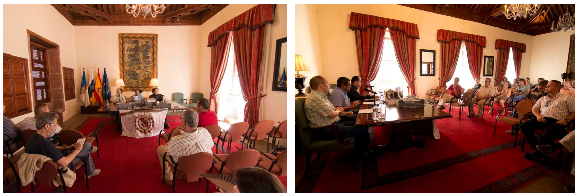
Presentación de la Asociación en la Casa Principal de Salazar el 25 de junio de 2011.

A partir de ese momento, algunos de los que desfilamos empezamos a desarrollar el proyecto de asociación, contactando con la colaboración de los organizadores, con más participantes en el desfile y a los que se han ido adhiriendo a partir de ese momento más aficionados a la reconstrucción histórica. Así nace la «Asociación Cultural de Recreación Histórica de La Antigua Guarnición de La Palma en el Siglo XVIII: los Doce de Su Majestad y Milicias de La Palma», fundada en Santa Cruz de La Palma en 2010 y presentada ante la prensa y el público el 25 de junio de 2011 en la Casa Principal de Salazar en Santa Cruz de La Palma. Se crea con el espíritu y el ánimo de ser una agrupación abierta a cuantas personas deseen sumarse a trabajar en dicho proyecto.