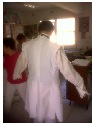
Vista de la casaca de prueba.

Hemos tenido la suerte de contar con la colaboración de diversos profesionales, que tanto desde dentro de la asociación como desde fuera, participan en la investigación y en la materialización de la uniformidad y equipos del período histórico a representar.