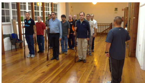
Instrucción en la Sala de la Recova (noviembre de 2012).