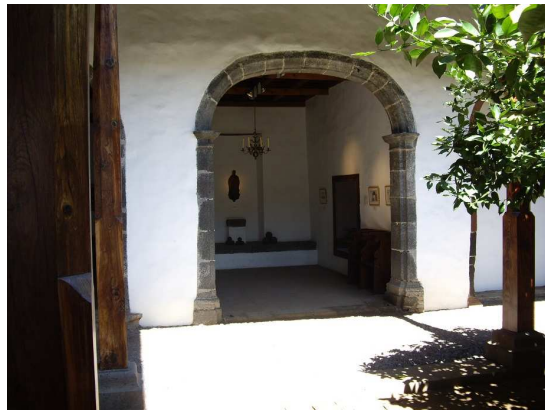
Capilla de San Francisco Solano, Convento de San Francisco.