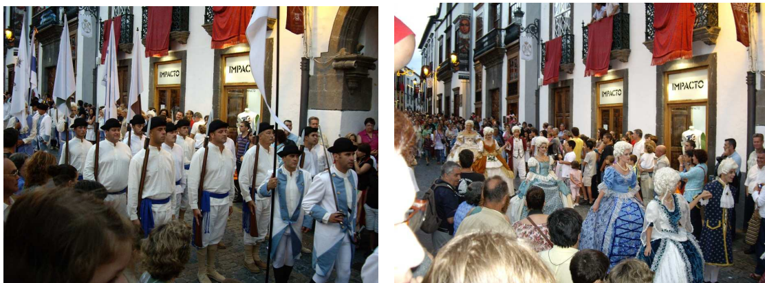
Bajada de la Virgen 2010. Desfile de las milicias y acompañamiento por parte de los participantes del «Minué».

Entonces se produce un acontecimiento durante las pasadas fiestas lustrales de la Bajada de la Virgen, que sirve de acicate e impulso para nosotros: nos referimos a la incorporación de un desfile histórico de las antiguas milicias palmeras por la calle Real de Santa Cruz de La Palma, incluido en el Festival del Siglo XVIII , más popularmente conocido como «Minué». Pese a no disponer de la uniformidad y el equipamiento militar adecuado, el resultado fue muy lucido, gracias al empeño de los organizadores y el de los participantes, y consiguiendo una gran aceptación entre el público.