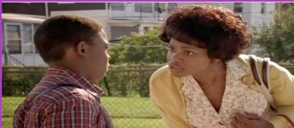
La niñez de Ben Carson Su madre le dió la valentía y le ayudó a conocer su inteligencia.