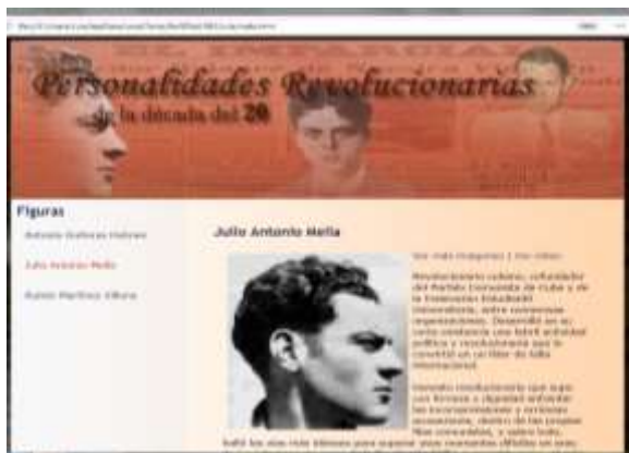
Figura. 2. Página Web Personalidades Revolucionarias de la década de 1920

Este Objeto de Aprendizaje (OA) tiene como objetivo, caracterizar la Guerra de los Diez Años dentro del proceso de lucha contra la dominación colonial en Cuba en el período de 1868 a 1878. Muestra una secuencia de hechos y personalidades que participan en dicha contienda, y entre sus finalidades está desarrollar habilidades a partir del dominio del contenido y consolidar elementos culturales de cubanía.