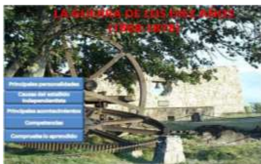
Figura. 2. OA Guerra de los Diez Años

todo, por la variedad de medios de enseñanza que resultan del desarrollo científico-técnico, la significación que estos adquieren al tener que confiarles el contenido y los entornos donde se produce la acción educativa, y su carácter sistémico, que posibilita tomar decisiones sobre su utilización en la clase. Figura 2