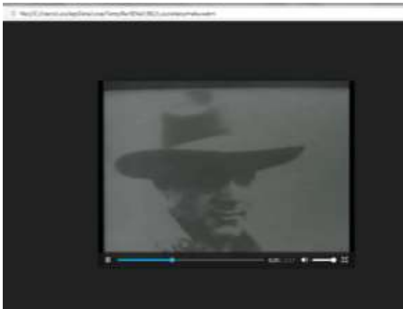
Figura. 3. Video Julio Antonio Mella

Los autores fundamentan que la significatividad de los REA no se centra, solo en la innovación, si no en el perfeccionamiento del proceso de enseñanza-aprendizaje de la asignatura Historia de Cuba, particularmente en la utilización de estos como medios de enseñanza. Los REA por sí solos no transformarán las prácticas educativas. Estos medios de enseñanza, no conducen automáticamente a elevar la calidad del proceso. Constituyen elementos esenciales la preparación de los profesores para impartir el contenido y contribuir al aprendizaje de los estudiantes.