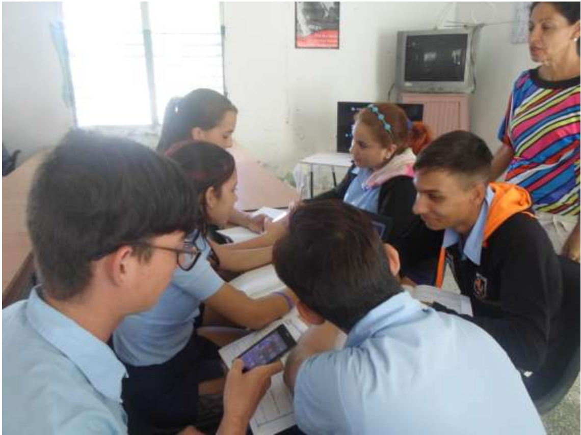
Festival de medios de enseñanza