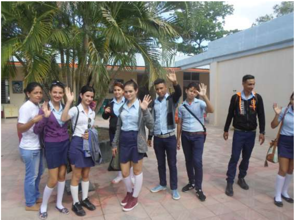
Jornada científica Pedagógica