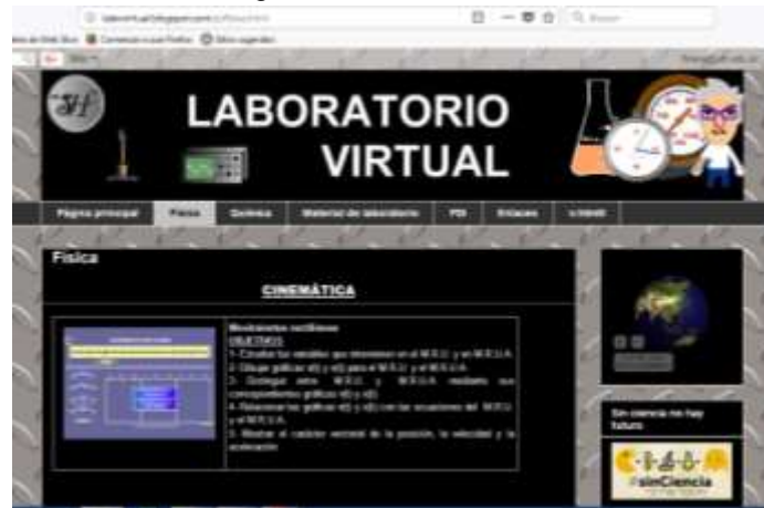
Imagen 3. Laboratorio Virtual