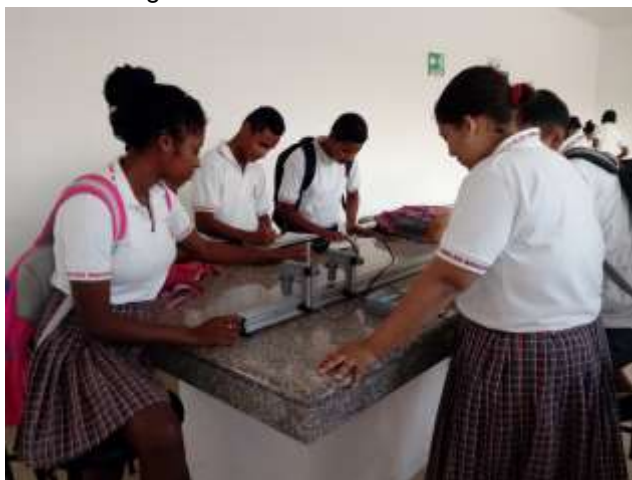
Imagen 1. Práctica en laboratorio real

En el laboratorio virtual como tal, se cuenta con una computadora con conexión a internet y un proyector acomodados en la misma sala del laboratorio real. Cada grupo establecido tiene el tiempo necesario para utilizar el computador y tomar los datos para resolver lo planteado en el reporte de laboratorio. El proceso de trabajo en el laboratorio virtual fue el siguiente: