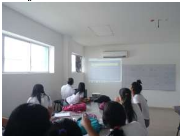
Imagen 2. Práctica en el Laboratorio Virtual

En la web podemos hallar diversos Laboratorios Virtuales, para este estudio se utilizó el blog LABORATORIO VIRTUAL, el cual está ubicado en http://labovirtual.blogspot.com/