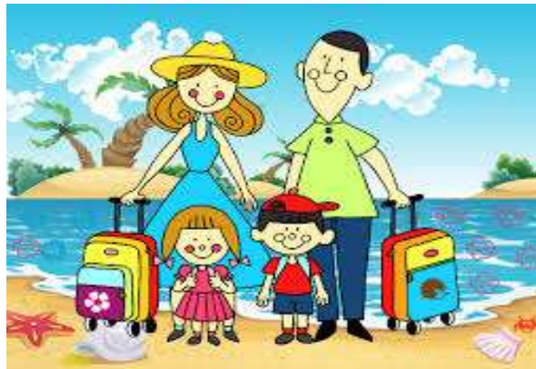
Figura 8: Asociación lógica