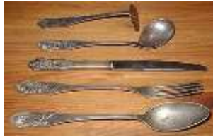
la cuchara, el tenedor y el cuchillo