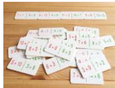
Figura 10: Desarrollo del pensamiento lógico y sociabilidad