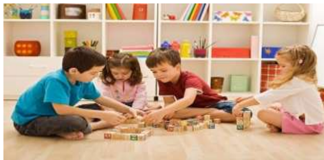
Figura 6: Manifestaciones de juegos de construcción