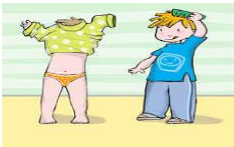
Figura 11: Independencia