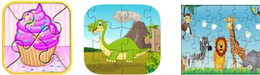
Figura 7: Rompecabezas para los menores

aumente su complejidad de manera paulatina puede ir aumentando los colores, la cantidad de objetos y también la cantidad de piezas a armar.