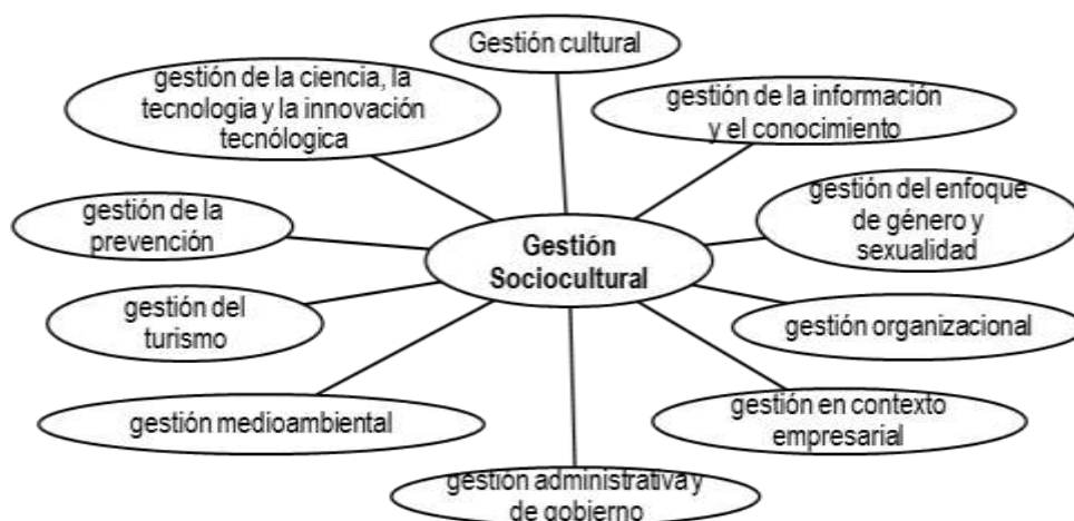
Esquema # 2: La gestión sociocultural y sus modalidades o esferas. Tomado de tesis doctoral (en proceso de Borges Machín, A. Y. 2018)

En la concepción de formación para el desempeño en contextos de gestión sociocultural se reconocen diez modalidades. (Borges Machín, 2018:26)