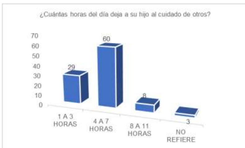
Tabla 2. ¿Cuántas horas del día deja a su hijo al cuidado de otros?

El autor Piaget nos habla en su teoría sobre la socialización, iniciativa, operaciones racionales como son: el análisis, la semejanza, diferencias, recordar, la afectividad, los procesos cognitivos son: el lenguaje, la multisensorial, el aprendizaje, el control del cuerpo, el pensamiento, la memoria y la concentración, entre otras, que podrán ser pulidas en el centro lúdico, mientras las madres universitarias estudian y siente seguridad física y emocional por sus hijos.